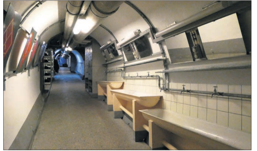
Couloir et lavabos