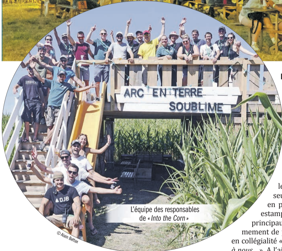
L'équipe des responsables de « Into the Corn »