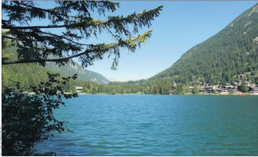
Lac de Champex

On ne présente plus le lac de Champex, bien connu, l'un des plus beaux plans d'eau de montagne à 1500m d'altitude, à la fois animé et calme, très apprécié des familles. Mais sait-on qu'à proximité est situé un fort d'artillerie? Il a été construit dans le roc d'octobre 1941 à décembre 1942 et répondait à l'esprit du Réduit national institué par le général Guisan, vu les plans d'invasion de la Suisse par l'Allemagne nazie et l'Italie fasciste. Il n'était pas un élément isolé, mais faisait partie de tout un réseau de fortifications et était notamment en contact avec l'immense fort de Dailly. Puis, pendant la guerre froide, il fut modernisé et adapté à la guerre nucléaire. Classé «secret» jusqu'en 1999, ensuite désaffecté, il fut repris par l'Association Pro Forteresse. Il peut