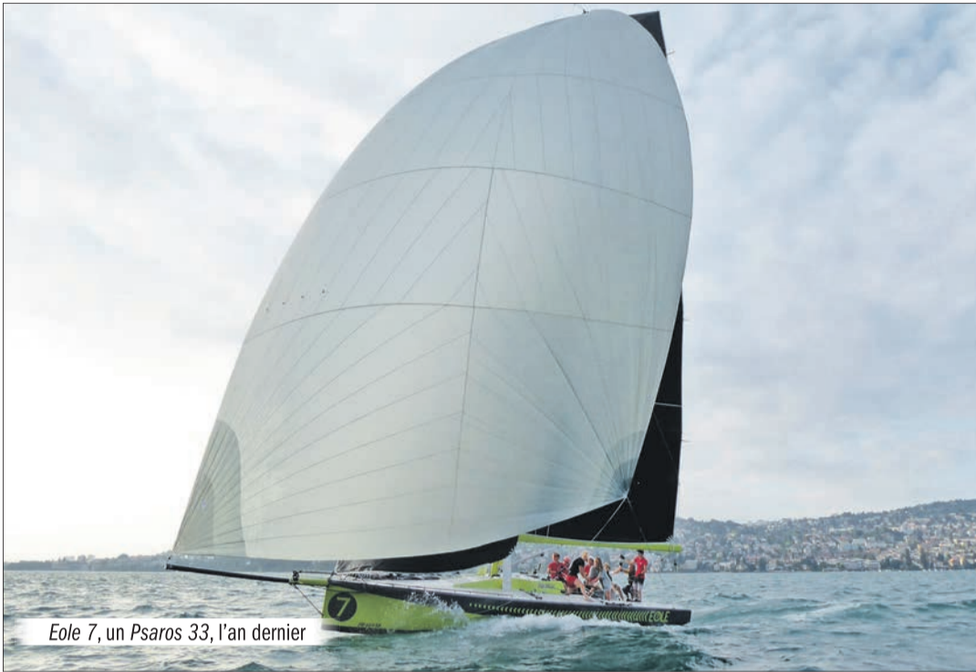
Eole 7, un Psaros 33, l'an dernier