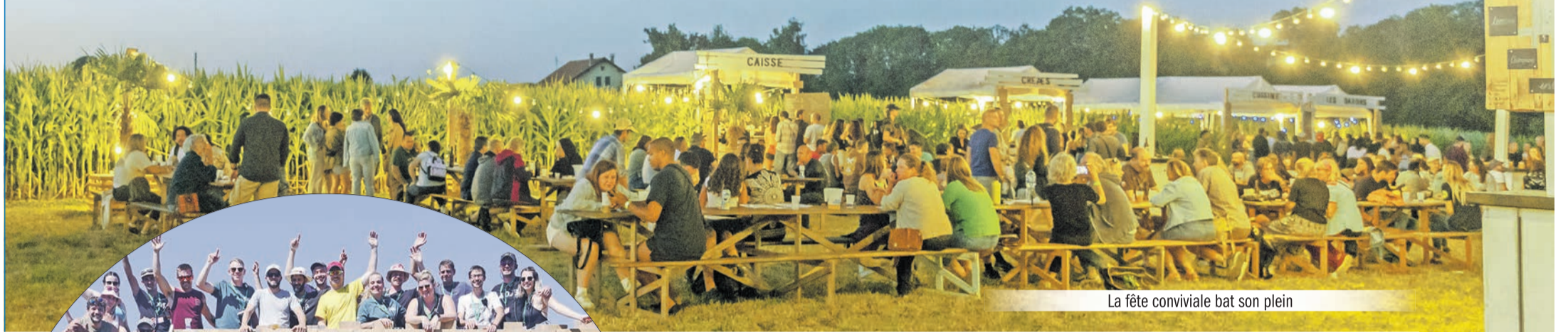
La fête conviviale bat son plein

Deux journées de rêve ont couronné le Festival « Into the Corn » (dans le maïs), les 12 et 13 août derniers à Mézières. Vendredi 1000 personnes ont assisté à la fête.