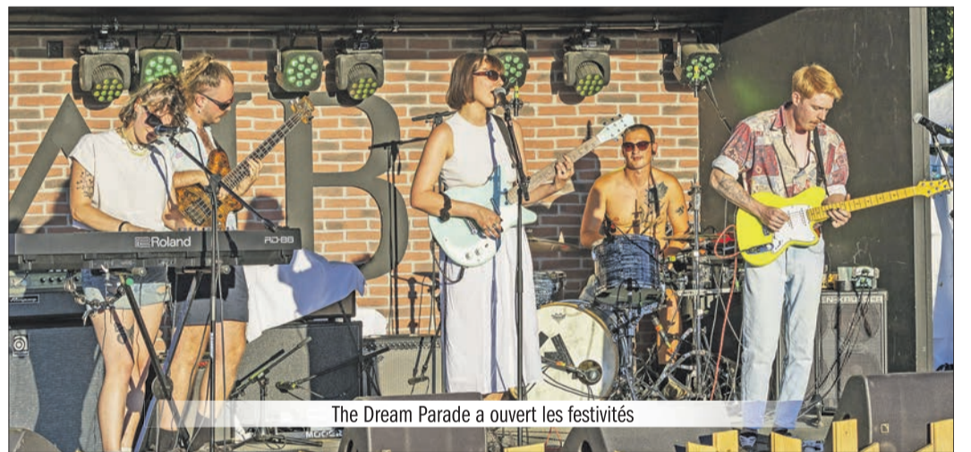
The Dream Parade a ouvert les festivités

Un agriculteur avait mis à disposition un très grand champ de maïs entre Mézières et Servion (le papa de deux organisateurs). Bien lui en prit, car les bénévoles (plus de 80), avaient formidablement organisé et géré cet endroit qui doit être remis «propre en ordre» peu après. Si quelques files d'attente pour se procurer de la nourriture ou des boissons doivent être à revoir pour les prochaines éditions, tout s'est déroulé par une formidable ambiance. Malgré l'énorme travail des bénévoles, malgré la fatigue, le public a répondu présent, il était heureux de participer à cette fête.