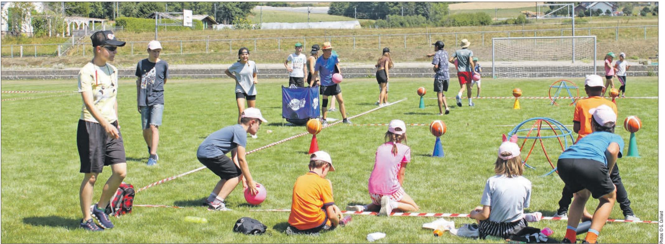
Les enfants pratiquant les jeux de balle

Soleil, chaleur, légère brise, joyeux cris d'enfants, balles qui voltigent, sirène de bateau, signalant le changement de jeux, mis à part l'absence de la mer, l'ambiance des KidsGames organisés aux abords du complexe sportif de Palézieux n'a rien eu à envier aux plages animées de la Méditerranée, en cette deuxième semaine d'août.