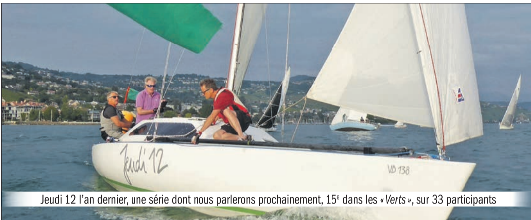
Jeudi 12 l'an dernier, une série dont nous parlerons prochainement, 15 e dans les « Verts », sur 33 participants