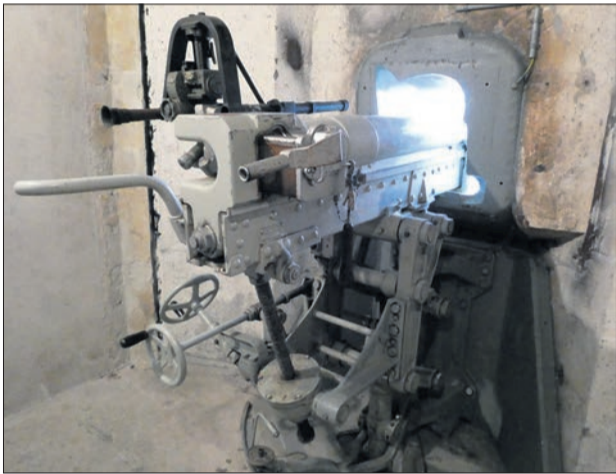
Batterie de 7,5 cm

Visites à quelques dates en juin, puis du 1 er juillet au 31 août , du mercredi à dimanche à 14h et 16h30, les 4 et 5 septembre à 16h30. Toute l'année, visites de groupes (minimum 10 personnes) sur réservation. Pour plus de précisions, s'adresse à l'Office du tourisme: champexlac@saint-bernard.ch