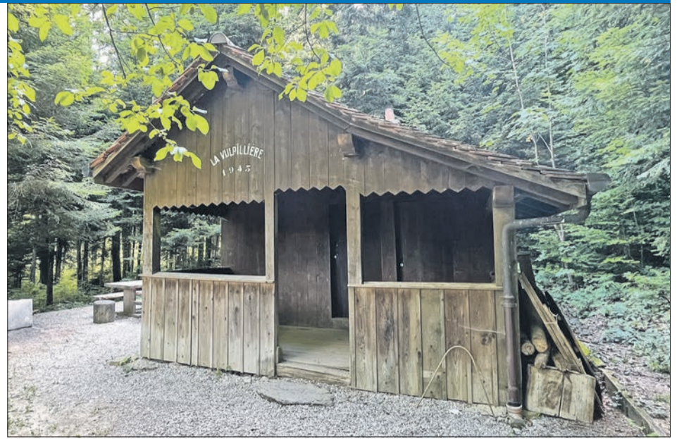
La cabane de la commune de Saint-Saphorin à la Vulpillière