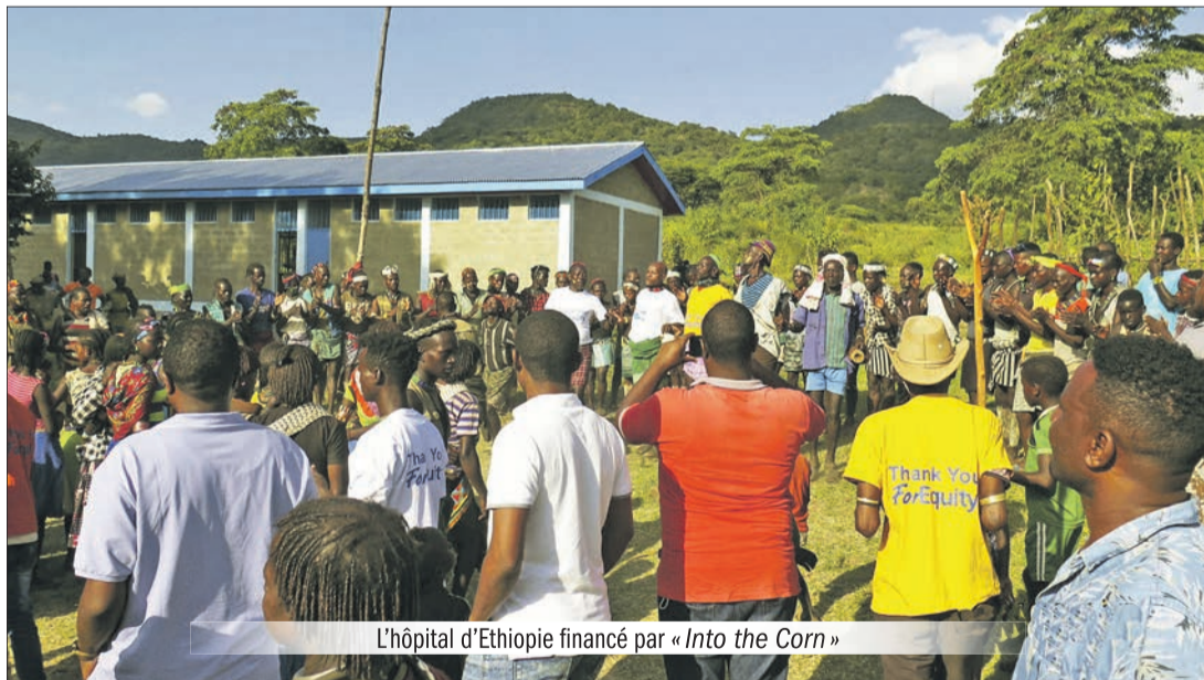
L'hôpital d'Ethiopie financé par « Into the Corn »