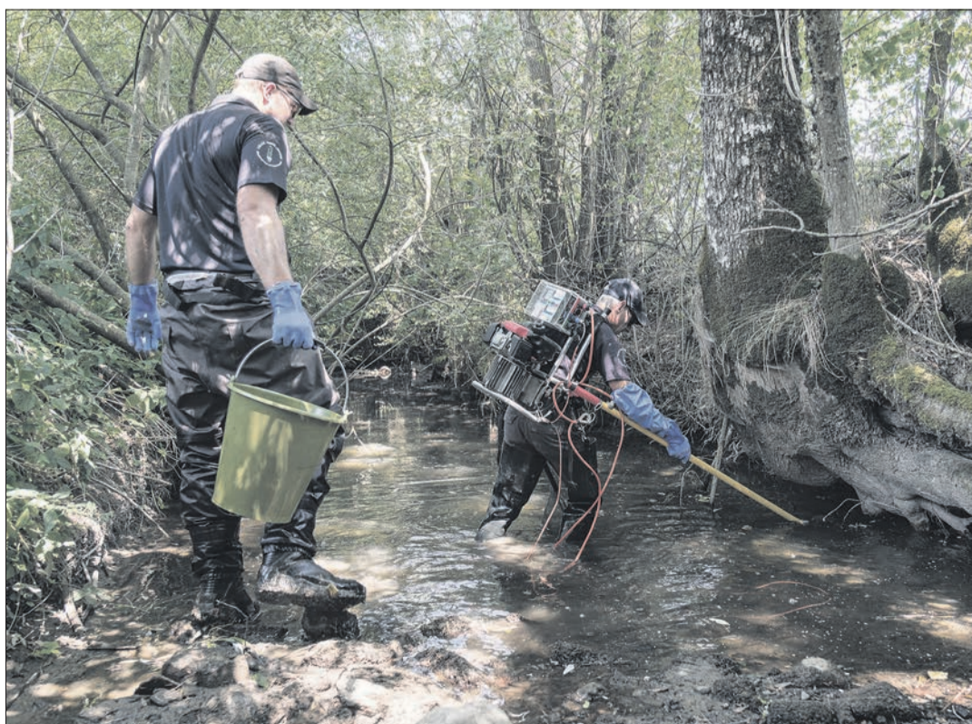
Grâce au procédé de pêche électrique, les deux garde-pêches peuvent déplacer les poissons quasiment sans stress. Le but est de les remettre dans de l'eau mieux oxygénée en aval ou en amont avant que les pluies fassent remonter le niveau des ruisseaux

Avec cette sécheresse, tout le travail de rempoissonnement et d'amélioration des eaux des années passées semble avoir été vain. Mais pour le garde-pêche, la nature