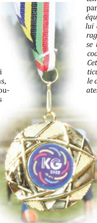
La médaille des Kidsgames