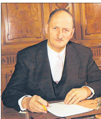
Paul Chaudet, président de la Confédération, lors de son allocution le 1 er août 1959

jeunes et moins jeunes dans un même geste de solidarité, n'est-ce pas là une invitation de s'engager avec son cœur et son intelligence, libre de haine et de peur, à servir son pays pour qu'il récolte encore et toujours les fruits d'un combat séculaire mené par nos pères. Tout cela ne peut être oublié, ni aujourd'hui, ni demain, même si notre pays a connu une évolution diligente pour ne pas dire brutale qui a surpris tout le monde et a parfois laissé des traces cruelles.