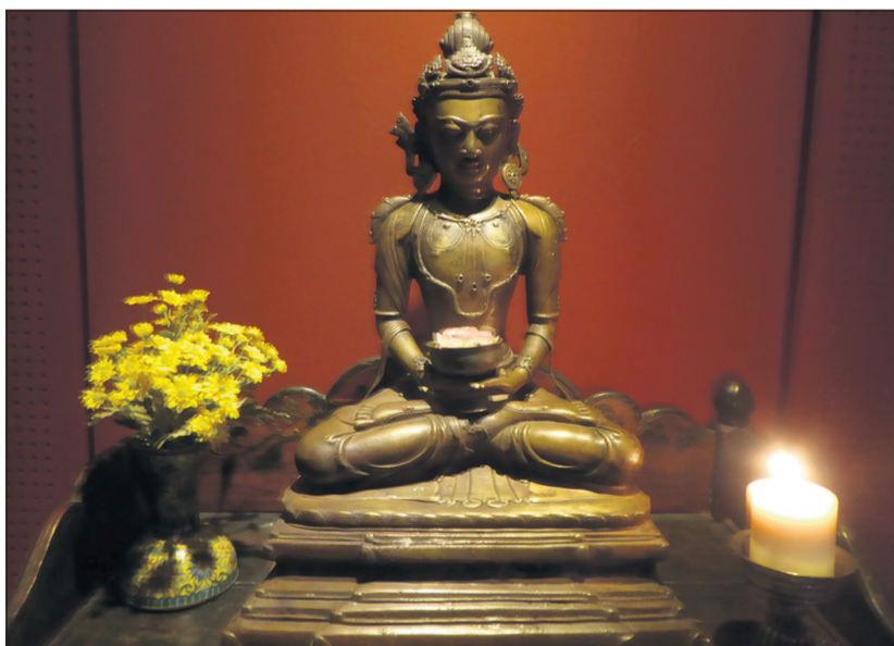
Un bouddha du Musée tibétain