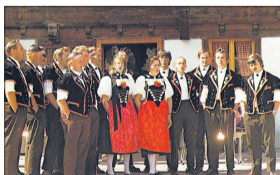
Du cœur de chanter en chœur pour la patrie

Tous, et vous avec moi, chers lecteurs, avons un profond respect pour ce courage et cette volonté. Tous ensemble, nous fêterons pour la 730 e fois et avec fidélité ces héros du premier jour. N'est-il pas émouvant de constater une fois de plus que c'est de leur désir et de leur volonté de s'unir et de s'aider qu'est née notre belle patrie? A l'heure où des milliers de feux, symboles universels de la joie, s'al-