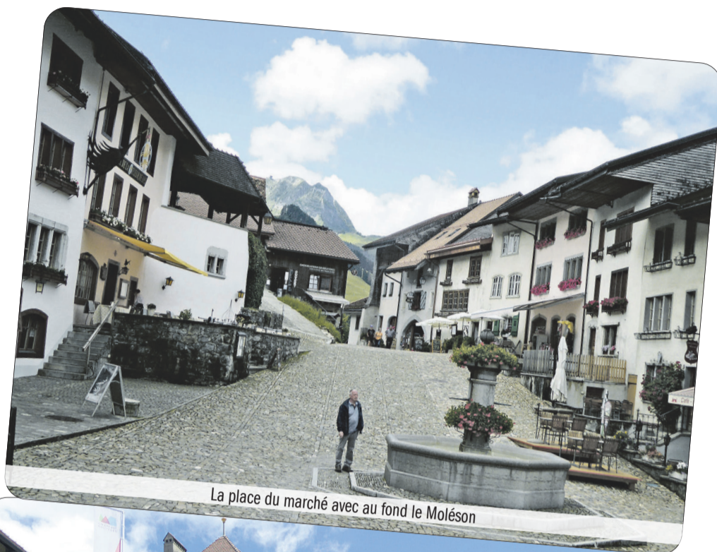
La place du marché avec au fond le Moléson

On débouche sur la place du marché joliment pavée, qui constitue un ovale, autour duquel s'agencent une série de belles maisons du Moyen Âge et de la Renaissance. Immédiatement après la porte, à notre droite, nous voyons la tour de Chupya Barba (termes en patois signifiant barbe brûlée), ainsi nommée parce qu'à l'époque médiévale, on avait la fâcheuse coutume de brûler la barbe des prévenus pour les faire avouer. Une curiosité à ne pas manquer: des mesures à grain, taillées dans une énorme