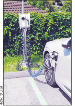
Borne de recharge

Avec le lancement des voitures électriques qui sont toujours plus nombreuses sur les routes de notre pays, il est évident que le nombre de bornes n'est pas suffisant pour recharger les batteries. Parfois, elles sont trop lointaines les unes des autres, ce qui oblige les automobilistes à attendre des heures à faire la queue. A ce jour, la Suisse compte 3641 bornes de recharge, soit autant que de stations-service. Avec l'augmentation du trafic, il est indéniable qu'il faudra les multiplier.