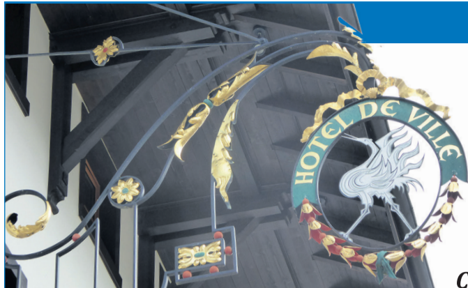
La grue emblème de la cité

Tout d'abord un conseil pratique: évitez la visite pendant les vacances et les week-ends, car le site, mondialement connu, attire des foules de touristes venus de Suisse et du monde entier! Choisissez plutôt l'entre-saison et les jours de semaine.