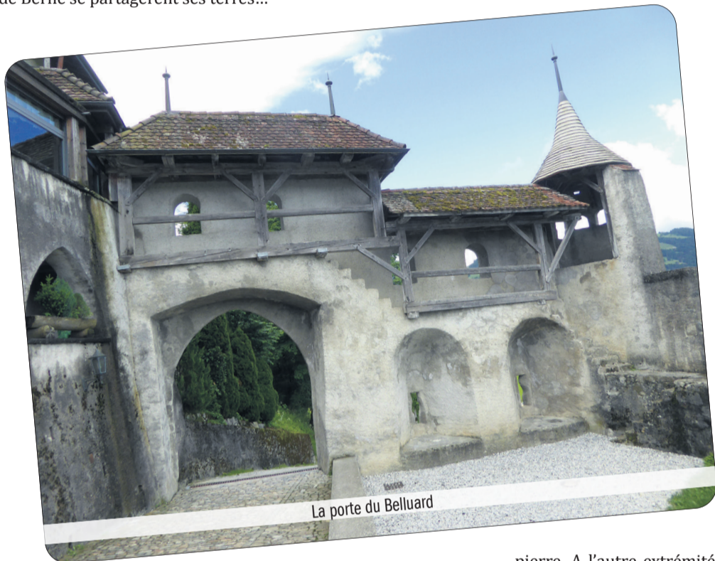
La porte du Belluard

pierre. A l'autre extrémité de la place, le Calvaire, bâti au 16 e siècle.