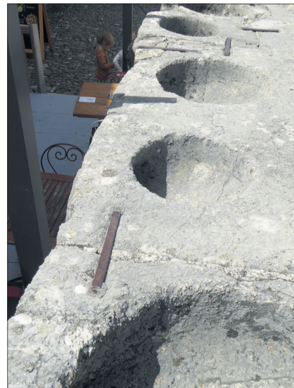
Les mesures à grains

Et revenus dans l'univers profane, pourquoi ne pas terminer la visite par la dégustation d'une fondue moitié-moitié ou fribourgeoise au vacherin?