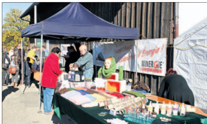
Marché du terroir 2014

Inauguré en octobre 2010, le Marché du terroir s'est petit à petit imposé comme une manifestation attendue par une clientèle fidèle et fait maintenant partie des traditions locales. C'est dans une très bonne ambiance que les membres fondateurs ont