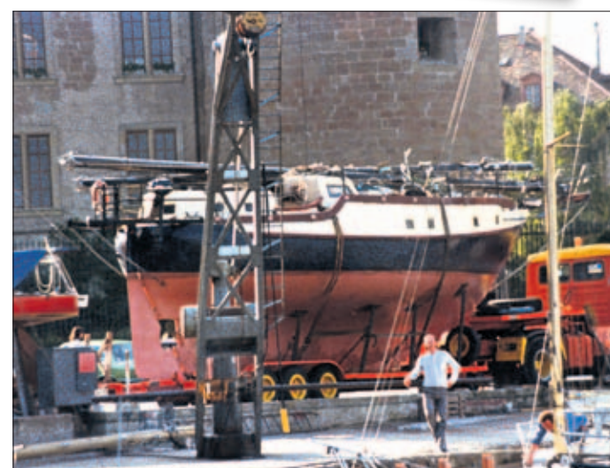
«Christer» au départ de Morges