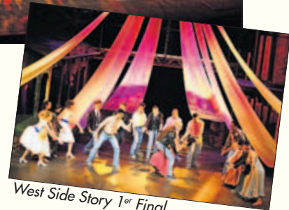
West Side Story 1er Final

Durand. Une distribution très judicieuse, une mise en scène talentueuse et près de 25 participants ont redonné vie à cette comédie musicale mythique. Une nouvelle orchestration réalisée par Erich Lauer donna un nouvel élan de jeunesse à ce spectacle.