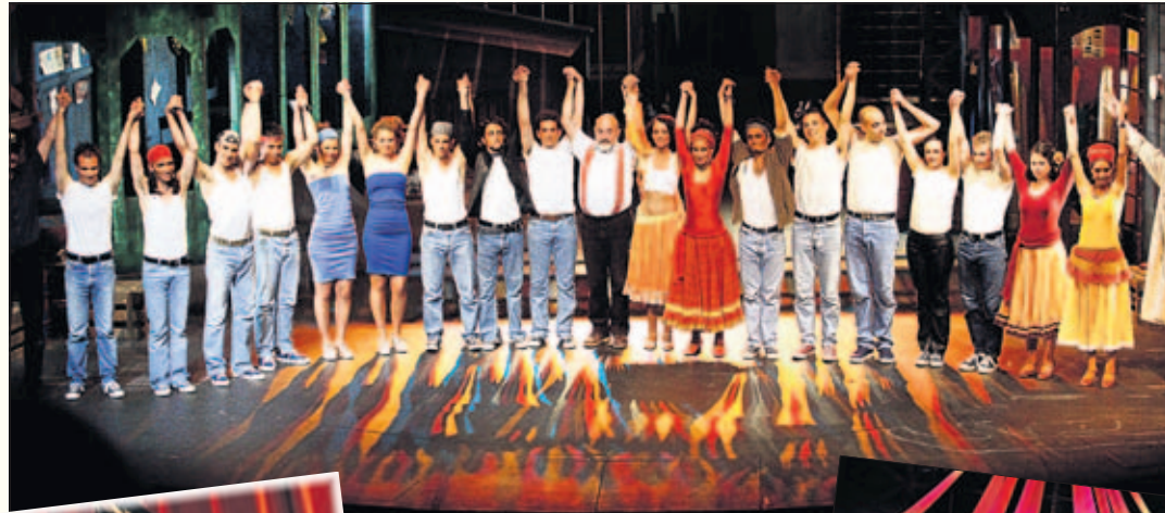
Salut final - West Side Story

En juin, soirée du ballet «Rudra Béjart». Nous accueillons, pour deux représentations, le Ballet Béjart et, bien sûr, Monsieur Maurice, en personne. Il revient plusieurs fois également avec le Ballet Rudra en 2005 et 2012. Je le vois toujours surveiller attentivement toute sa troupe.