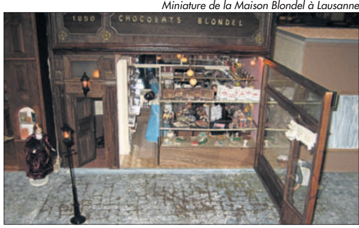
Miniature de la Maison Blondel à Lausanne