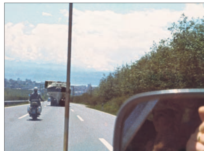
Escorte de police