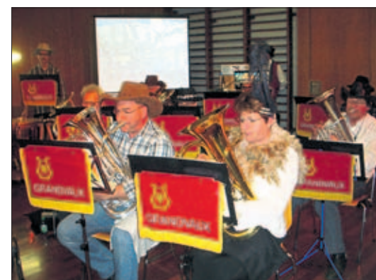
Voyage aux USA

P our ses concerts 2015, et selon ses habitudes, la Fanfare de Grandvaux a émigré tout d'abord à Paudex puis à Aran samedi et dimanche derniers. Rompant avec la tradition, ce n'est pas sur scène, mais bien sur le parquet de la salle communale de la cité du coq que les 30 musiciens ont réjoui un public fidèle, mais quelque peu clairsemé, avec un programme populaire. La seconde partie du programme a fait voyager musiciens et public sur des airs américains ponctués de vues typiques des USA. Introduites avec humour, voire poésie, les pièces choisies ont conquis l'auditoire.