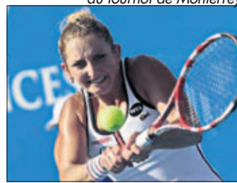
Timea Bacsinszky lors du tournoi de Monterrey