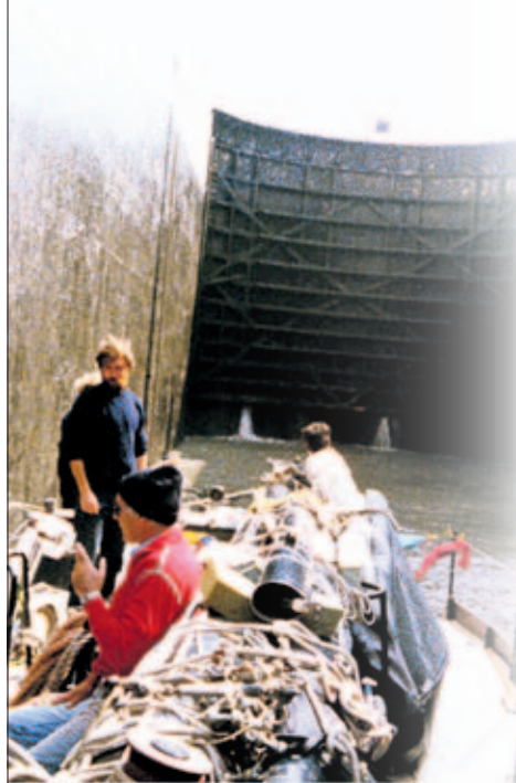
Le Rhône et les écluses