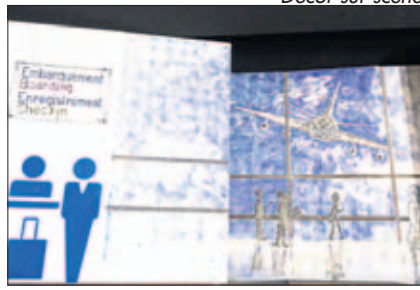
Décor sur scène

Bon alors... attachez vos ceintures, redressez votre siège,