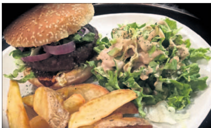
Spécialités culinaires «made in Chicago» sous forme d'«American Street Burger» et d'«American Home Burger» avec salade et «fried potatoes»

A Forel (Lavaux), le café-restaurant Route 66 affichait complet samedi soir 7 mars à Forel (Lavaux) pour sa soirée dédiée à l'Etat nord-américain de l'Illinois. Spécialités culinaires et groupe de rythm and blues à l'appui, le public présent est resté jusque tard dans la nuit. La prochaine soirée à thème prévue en juillet sera dédiée à l'Etat du Nouveau Mexique.