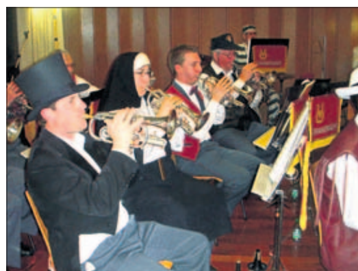
Musique et humour avec une parodie de Sister Act