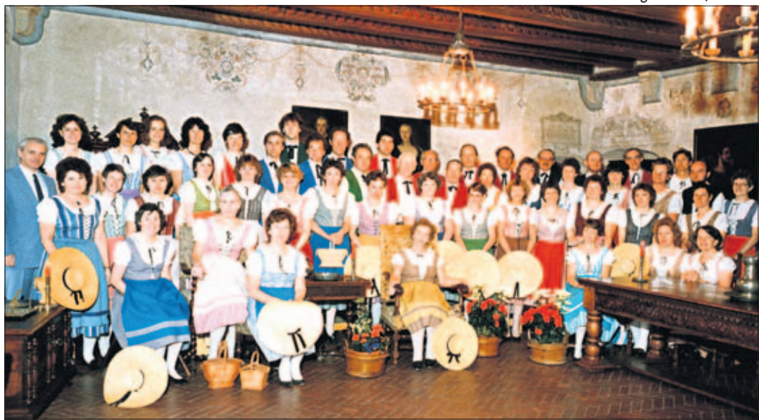
La Chanson Vigneronne (salle des chevaliers Buttin-de-Loës) et le Chœur d'enfants (Pressoir Buttin-de-Loës) en 1985