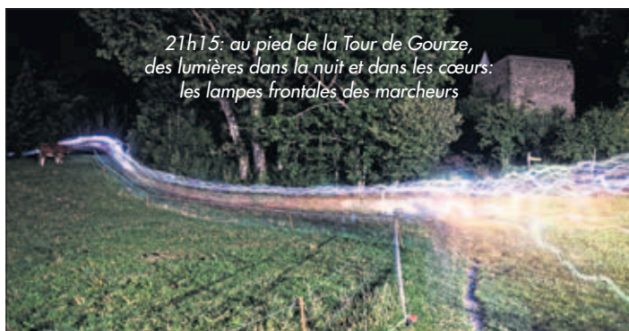
21h15: au pied de la Tour de Gourze, des lumières dans la nuit et dans les cœurs: les lampes frontales des marcheurs

cas d'incident. Ce ne sont pas moins de 200 participants qui ont quitté Lausanne, rejoints ou relayés par 150 personnes à l'étape de Saint-Martin. Enfin, à celle de Rathvel, 200 nouveaux marcheurs se sont joints à la dernière partie de cette marche.