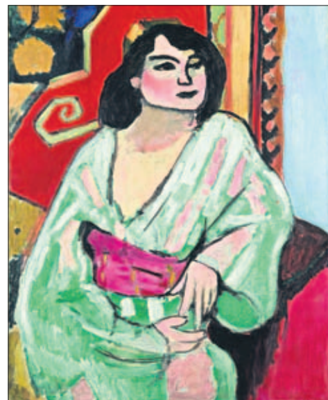
Henri Matisse, L'Algérienne , Huile sur toile, 81 x 65 cm