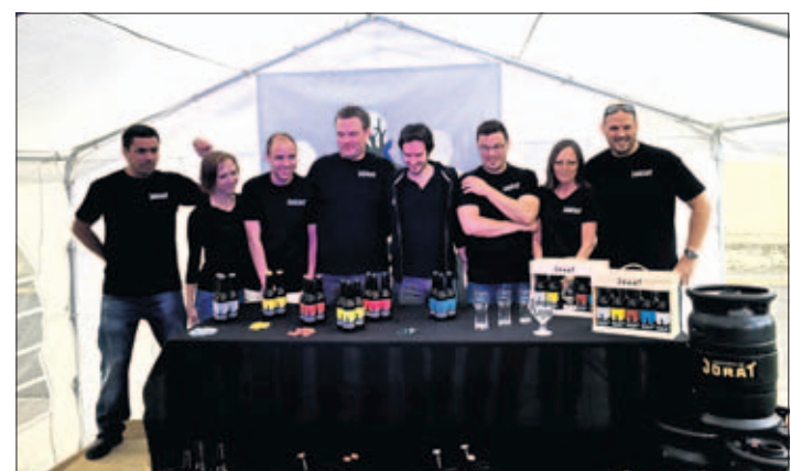
L'équipe de la Brasserie au complet