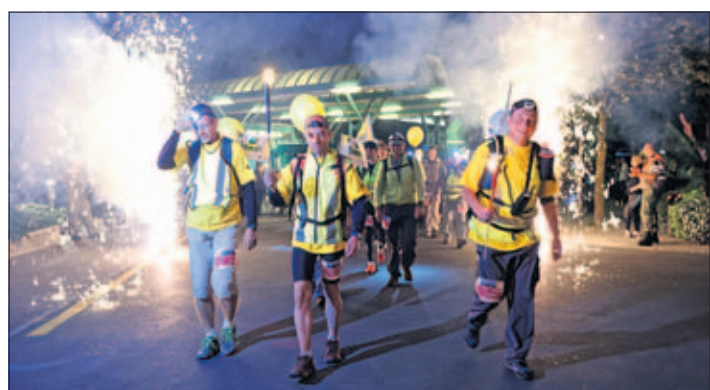
Minuit pile, le départ est donné sous les feux d'artifice

trajet d'une durée d'environ 16 heures pour 50 kilomètres, représentant cependant 75 kilomètres/effort, avec 2500 mètres de dénivellation. Pour ceux et celles qui ne disposaient pas d'un entraînement adéquat, ainsi que pour les familles, des parcours réduits avaient été prévus, ainsi que des étapes relais auxquelles ils avaient la possibilité de céder leur place à un autre sportif. Nous ne reviendrons pas sur l'idée et l'origine de