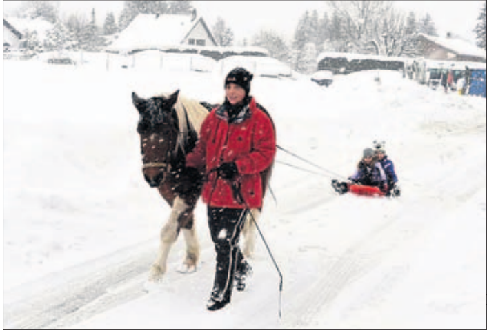
Les Cullayes, 1 er février - Au menu : balade de saison