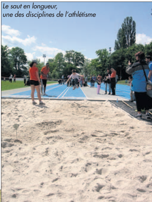
Le saut en longueur, une des disciplines de l'athlétisme

L'athlétisme est un sport qui regroupe un ensemble de disciplines: courses, sauts, lancers, épreuves combinées et marche. L'origine du mot athlétisme vient du grec athlos , qui signifie combat. Il s'agit de l'art de dépasser la performance de ses adversaires en vitesse ou en endurance, en distance ou en hauteur. Le nombre d'épreuves, individuelles ou par équipes, a varié avec le temps et les menta-