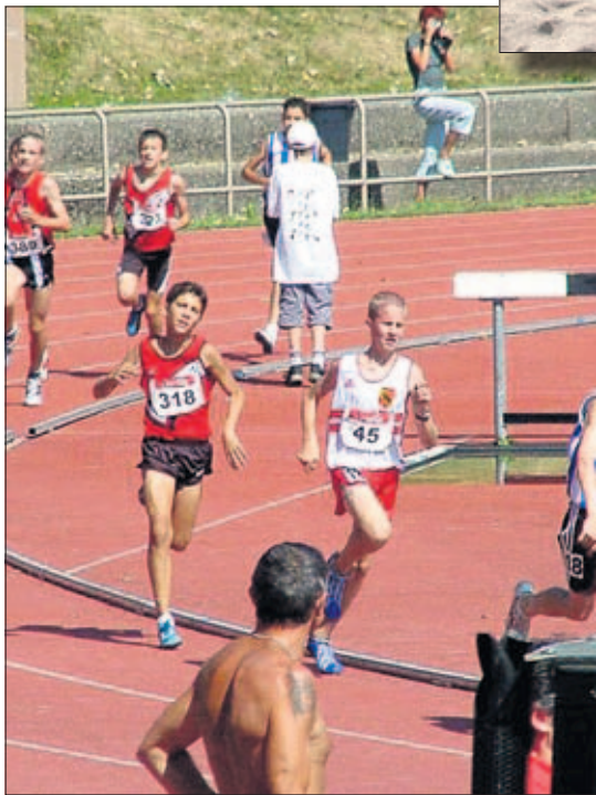
Très diversifié, l'athlétisme offre de nombreuses possibilités comme sport de base

lités. L'athlétisme est l'un des rares sports universellement pratiqués, que ce soit dans le monde amateur ou au cours de nombreuses compétitions de tous niveaux. La simplicité et le peu de moyens nécessaires à sa pratique expliquent en partie ce succès. Les premières traces de concours d'athlétisme remontent aux civilisations antiques. La dis-