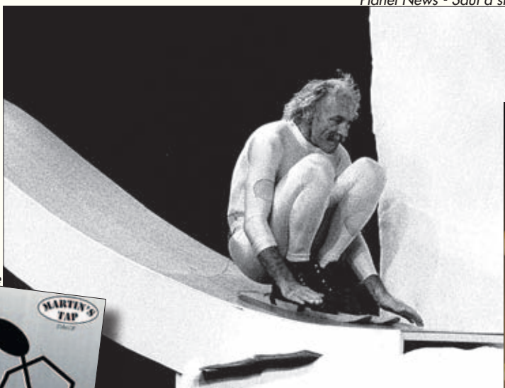
Saut à ski