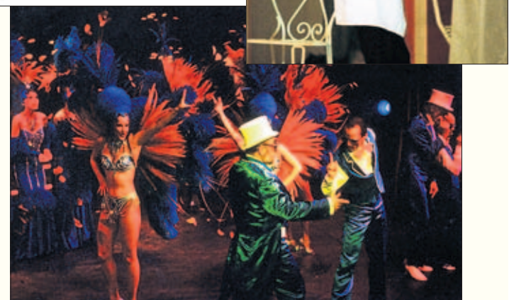
Planet News - Final