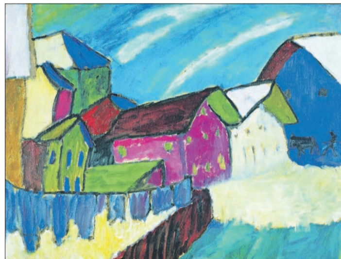
Dorfstrasse im Winter, 1911