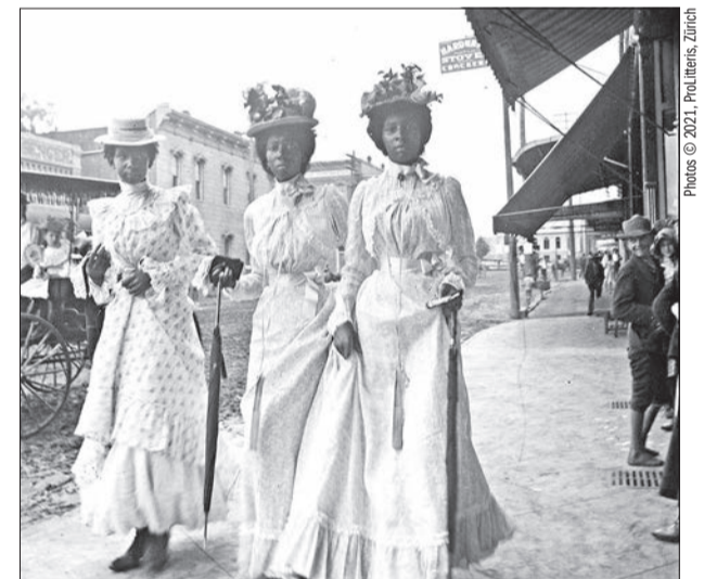
Drei Frauen im Sonntagsstaat, Marshall, Texas, 1899 - 1900