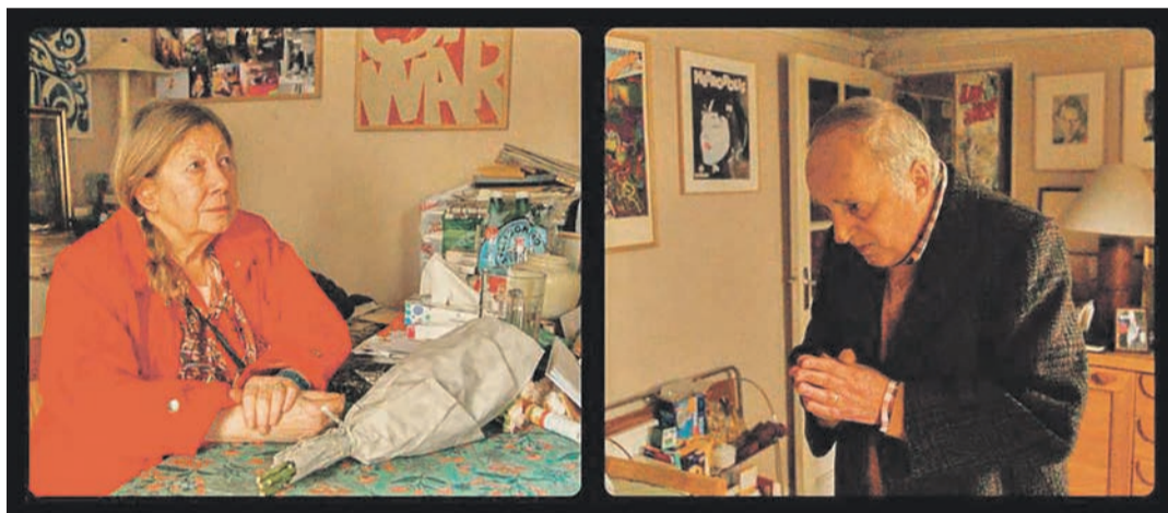
Raccord regard entre les deux écrans du split screen