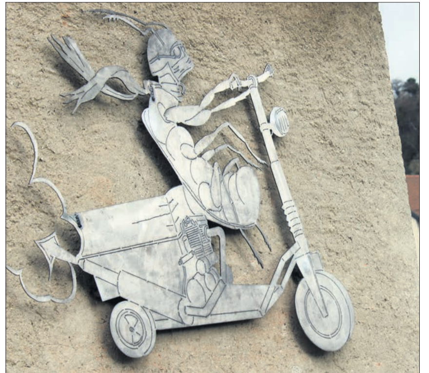
L'enseigne apposée sur le mur de la grange appartenant à la famille Siegenthaler, au chemin de Creyvavers

Ceux qui ont encore bien en tête les festivités et leurs passages au caveau n'auront certainement pas oublié l'un des éléments qui ornaient justement le caveau. L'enseigne créée par l'artiste Yaka. Cette journée des retrouvailles, n'était pas organisée pour permettre à cette joyeuse équipe de fourmis de se remémorer ses meilleurs souvenirs de la FEVI, mais devait également per-