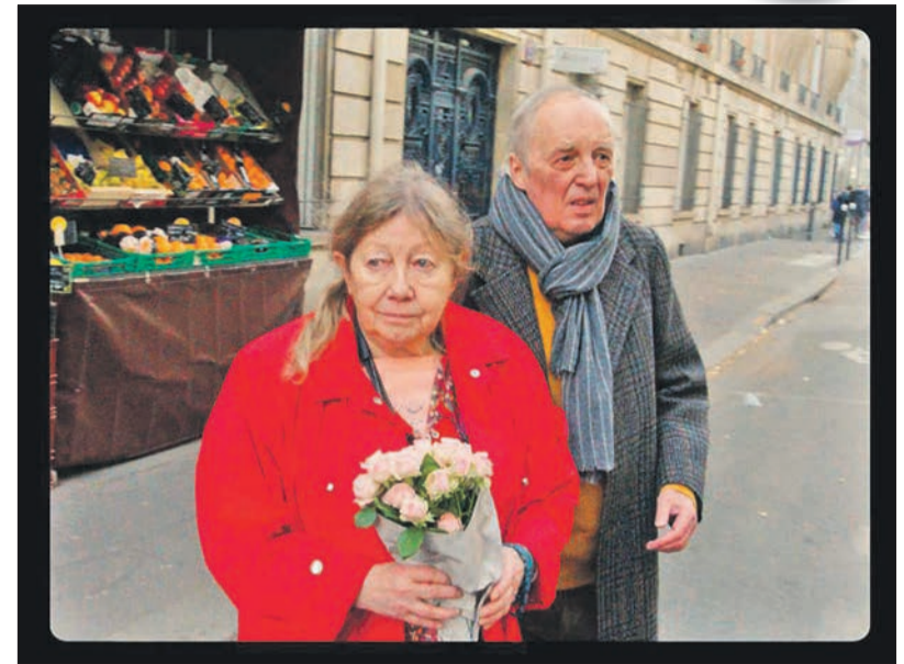
Au début du film, les personnages sont encore réunis dans un seul cadre. Ils passeront le reste du film séparés par deux écrans

Outre ces deux personnages principaux, leur fils est incarné par Alex Lutz, qui lui aussi peine à se gérer malgré un statut de père qui le force à marcher droit, ou plus ou moins en tous cas. Les trois acteurs et actrices se donnent ainsi la réplique, ou faudrait-il dire l'anti-réplique puisque le scénario de Gaspar Noé ne comportait à l'origine aucun dialogue? Tout a été improvisé lors du tournage en quasi-huis clos, donnant au film un ton singulier. L'originalité de jeu est relayée par un autre aspect saisissant: formellement, le film est profondément marquant puisqu'il place côte à côte les deux personnages pendant deux heures trente, tout en les séparant en deux petits écrans. Ce split screen permet ainsi de suivre de manière synchrone l'avancée de l'un et de l'autre des personnages, tout en conscientisant la séparation progressive qu'ils vivent et que le film narre. Cette séparation est montrée comme jamais auparavant au cinéma, d'une manière