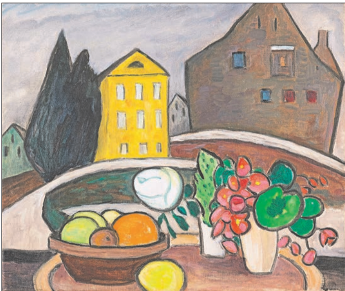
Stilleben vor dem gelben Haus, 1953

L'exposition présente un magnifique ensemble de peintures réalisées à Murnau et dans les environs. Celles-ci, faites de larges aplats de couleurs, font songer aux tableaux de Ludwig Kirchner à Davos. Même volonté de rompre avec les conventions, par le choix