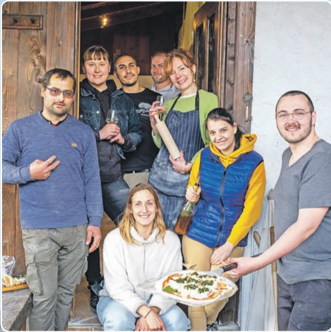
Les bénévoles en charge de la conception des pizzas bio. Ils estiment qu'environ 250 pizzas ont cuit dans le four à bois