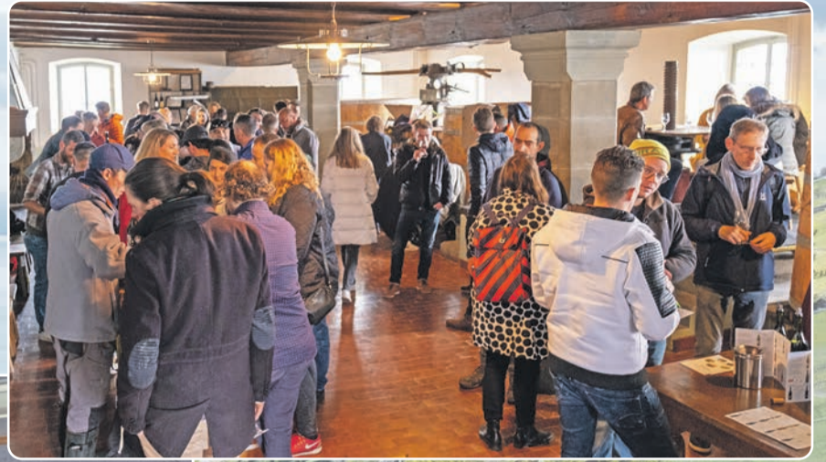
Le réconfort du Domaine a séduit de nombreux amoureux de vin bio. Si la vigne a toujours attiré une clientèle multigénérationnelle, on observe une diminution de l'âge moyen depuis quelques années