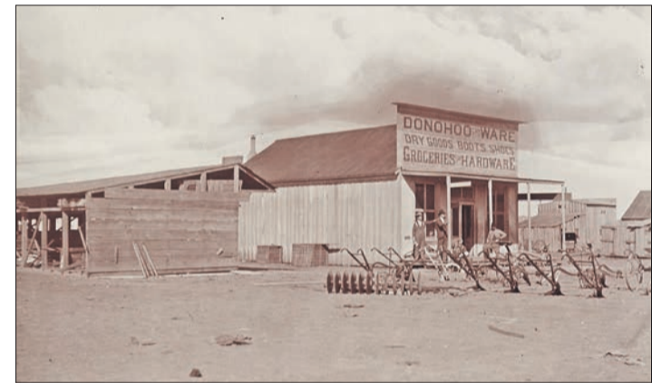
Donohoo's Warehouse, Plainview, Texas, 1899

« Gabriele Münter, pionnière de l'art moderne », Zentrum Paul Klee, Berne jusqu'au 8 mai (à noter que tous les textes et la brochure d'accompagnement sont également en français).