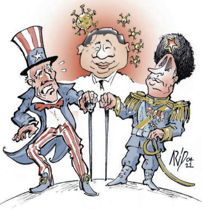
L'Empire du Milieu reprend le Centre

russe Vladimir Ilitch Oulianov, alias Lénine, qui dans son livre «L'Impérialisme, stade suprême du capitalisme», publié en 1917, accuse les grandes puissances capitalistes de son temps de vouloir se partager le monde, ses ressources et ses richesses.