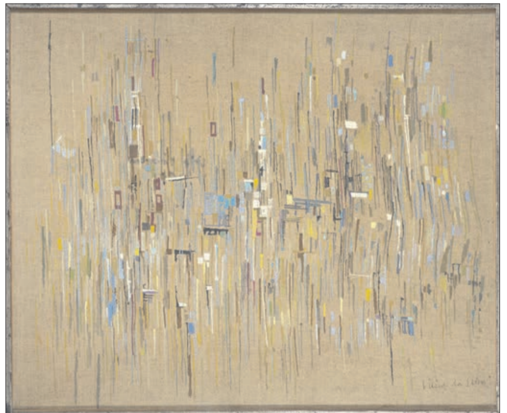
Maria Helena Vieira da Silva, Ville chinoise , 1951, 38 x 46cm

«Zao Wou-Ki collectionneur» Musée d'art de Pully, jusqu'au 15 décembre.