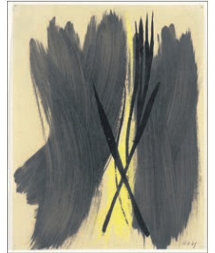
Hans Hartung, sans titre , 1949, 24 x 18 cm

Cette exposition pulliérane, certes exigeante, permet donc de mesurer l'évolution picturale considérable de Zao Wou-Ki, et en même temps d'admirer plusieurs œuvres d'autres célébrités de l'art contemporain.