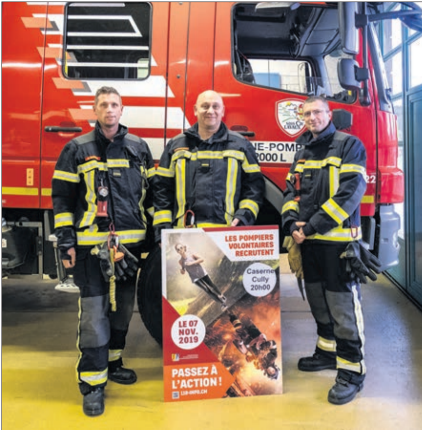
L'Etat-Major du SDIS Cœur de Lavaux