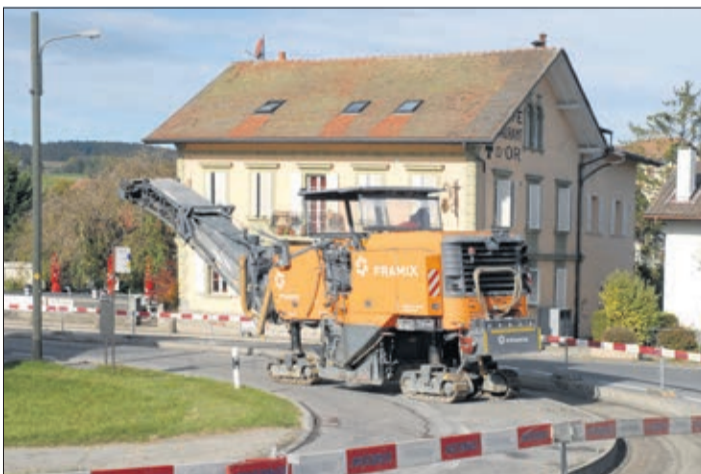
Une dégrapeuse «mange» l'asphalte de la route