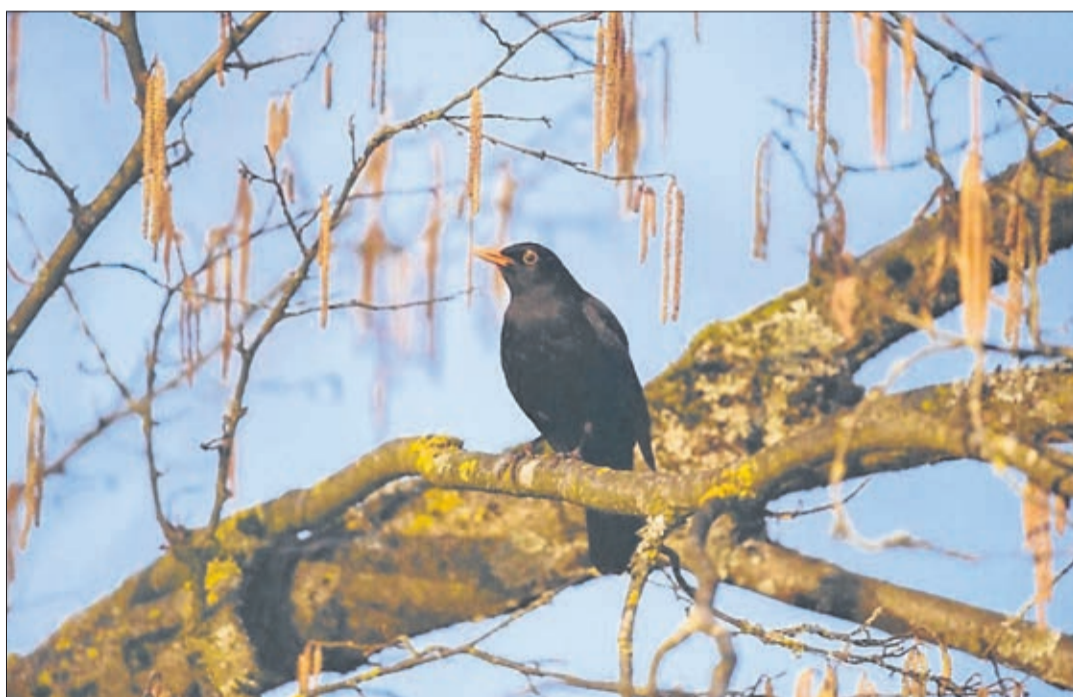
Le merle noir au chant mélodieux qui vit près des habitations

P arlons une fois des oiseaux qui - toutes espèces confondues - sont malheureusement chaque année moins nombreux. Et dans un proche avenir, ils seront aussi rares que les corbeaux blancs! Même avec des lunettes d'approche, je n'ai trouvé qu'un nombre restreint de nids dans les vergers et les forêts. Donc, mis à part les milans, les éperviers, les hiboux, les chouettes et les corneilles, il y a de moins en moins de volatiles et d'espèces dans la nature.