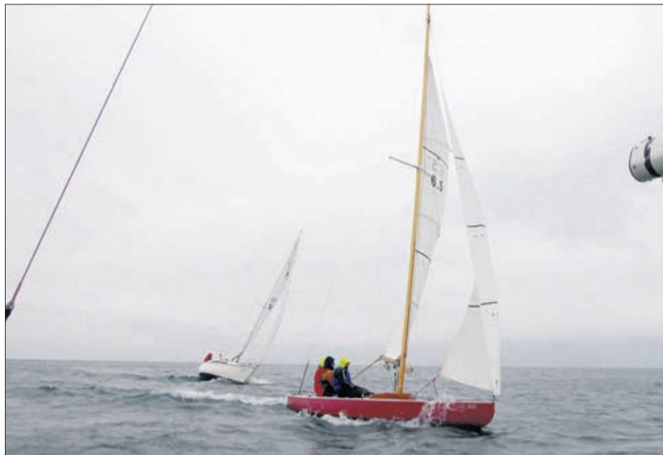
A bord de Solaire

Huit voiliers ont pris part à cette régata de clôture l'an dernier dans des conditions très fraîches, les rafales soufflant à plus de 40 km/h, vraisemblablement assez proches de celles que l'on peut attendre cette année. Kerosen , Wanted et Solaire terminaient dans cet ordre aux trois premières places.