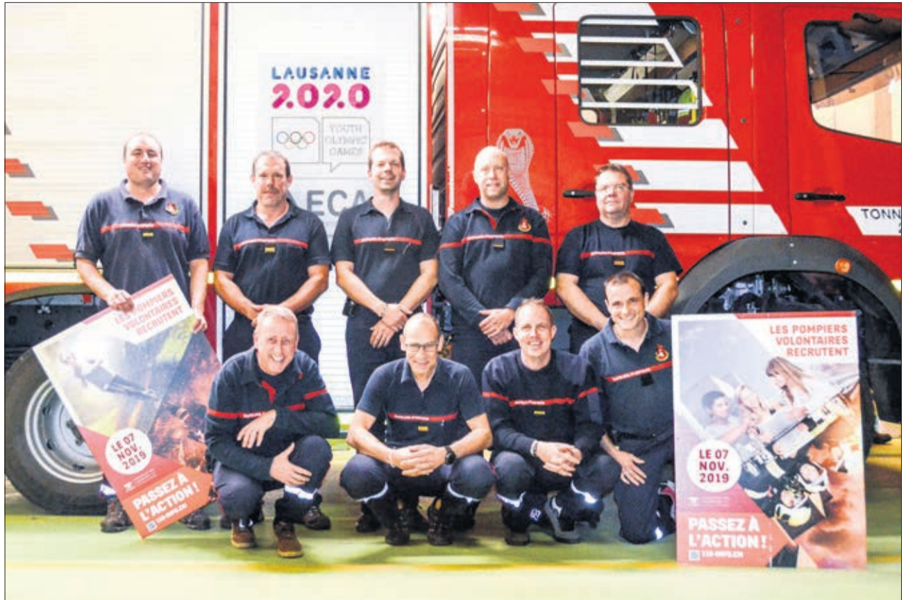
Le personnel du SDIS Oron-Jorat

Le 7 novembre prochain aura lieu l'habituelle soirée de recrutement des pompiers vaudois. Fort de 6000 hommes et femmes, les forces du feu ont sans cesse besoin de maintenir leurs effectifs afin d'assurer la sécurité des citoyens.