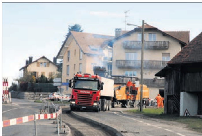
La dégrapeuse en pleine action, des camions à 4 essieux doivent suivre

D epuis Oron pour vous rendre au Chalet-à-Gobet à la sortie de Mézières au lieu-dit la Croix-d'Or ou à la zone industrielle l'Ecorcheboeuf, des feux alternés viennent d'être installés. De même, en provenance de Moudon, l'ancienne route suisse est fermée à la circulation, jusqu'au carrefour de la Croix-d'Or. Seuls, en sens inverse, sur cette route du Mottey, les véhicules pourront circuler.