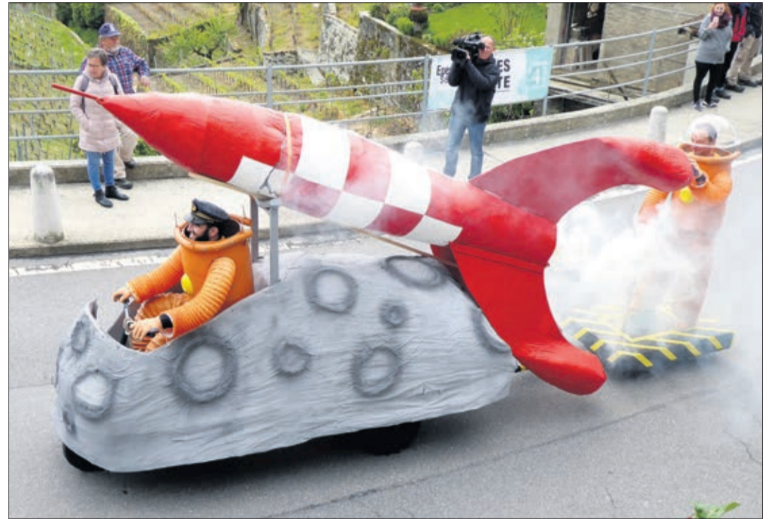
Tracalune rejoint la parade