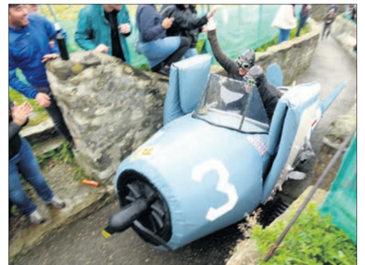
Têtes brûlées en plein vol du Pacifique