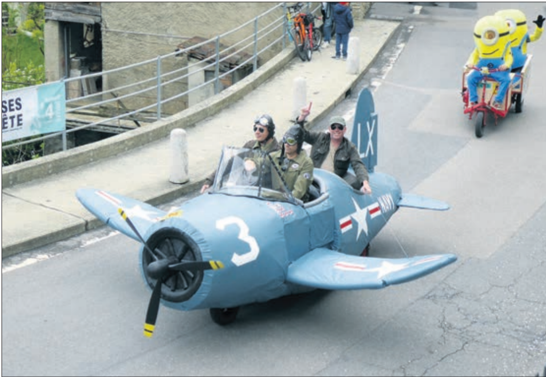
Volant vers la parade, Têtes brûlées précédant les Minions à Epesses