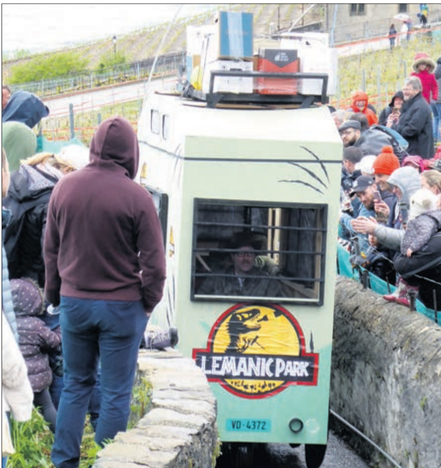
Lemanik Park dans la jungle du sentier de Creyvaers

La 21 e rencontre des tracassets à Epesses, ce dernier samedi, a confirmé son statut de Championnat du monde et a été un franc succès malgré les bourrasques, les averse et les éclaircies d'un temps d'avril.