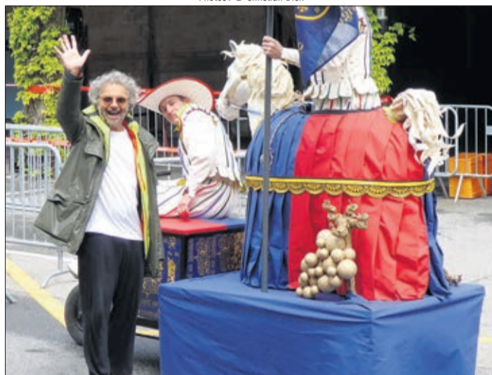
Daniele Finzi Pasca en public convaincu devant une version inédite de son spectacle FeVi 2019