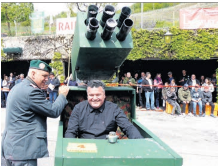
Kim Jong Tracass (Jean-René Gaillard et Manu Wahlen) à l'assaut d'une nouvelle conquête?