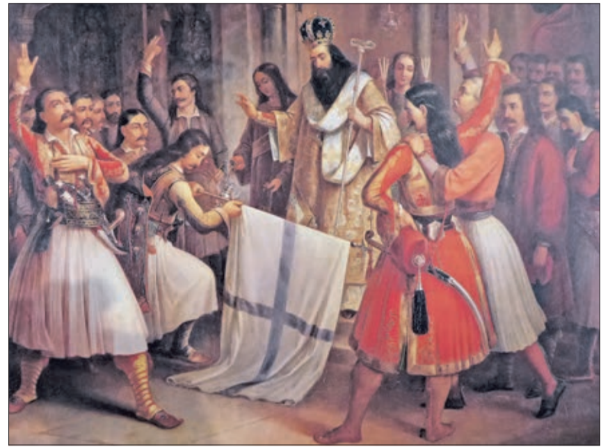
Le serment à Aghia Lavra

«Ioannis Capodistrias, le canton de Vaud et la révolution grecque» Forum de l'Hôtel de Ville de Lausanne Jusqu'au 19 juin