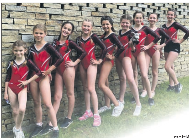
Master I Lutry - Gymnastes C2

Ces deux derniers week-ends, le groupe après des Amis-Gym Forel-Savigny a été bien occupé. Malgré l'assouplissement des mesures liées à la situation sanitaire, les manifestations ont eu lieu sans public et sans proclamation des résultats. Afin d'éviter les frais, surtout en cas d'annulation, les comités d'organisation de cette année ont pris la décision de ne pas remettre de médailles, ni de distinctions, mais d'organiser tout de même les «Master» agrès, afin que les gymnastes vaudois puissent se retrouver en salle de compétition.