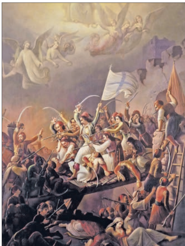
La tentative de sortie désespérée des assiégés de Missolonghi en 1826