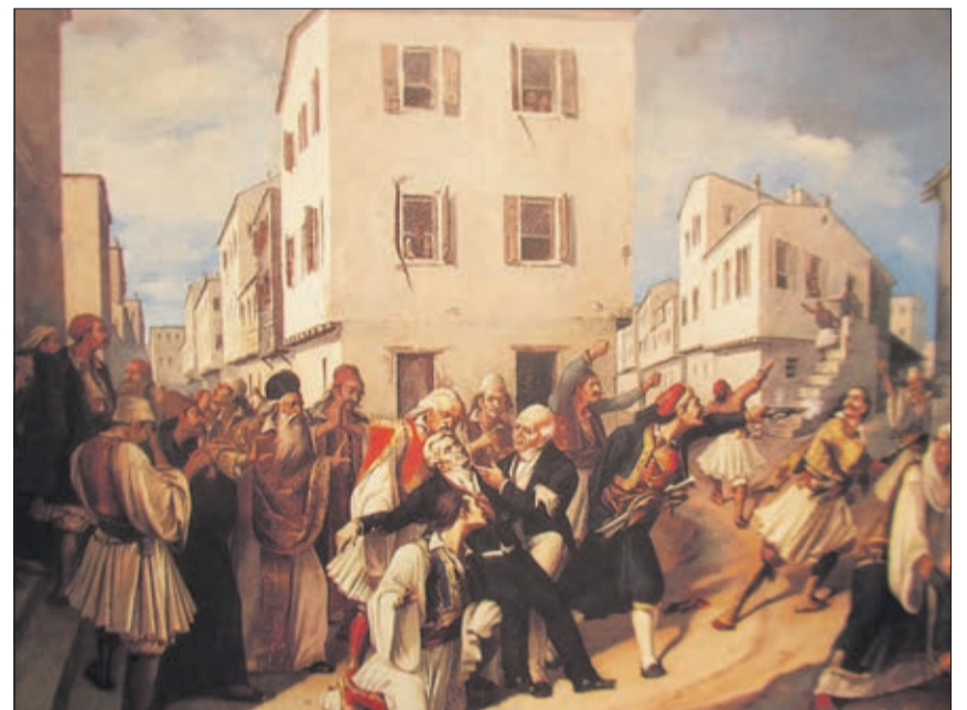
L'assassinat de Capodistrias