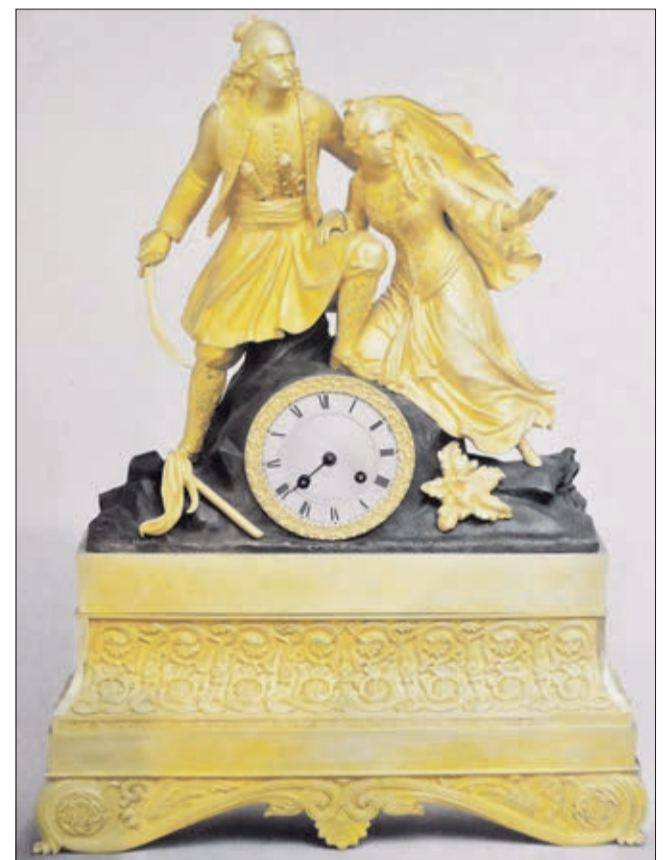
Pendule philhellénique française