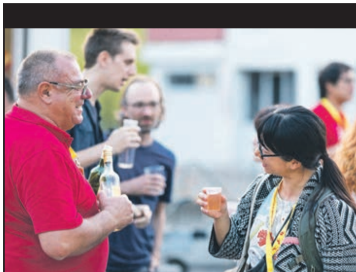
Le festival propose des moments de partage...

Y aura-t-il un jour un formidable artiste pour concrétiser un film d'animation sur le thème de cette terrible pandémie ? En tous les cas, ce ne sont ni les idées, ni les talents qui manquent dans ce domaine si captivant du 7 e ou 8 e art.