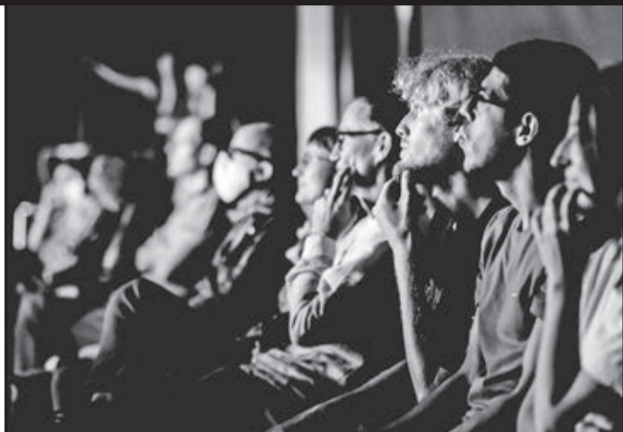
... de passion ...