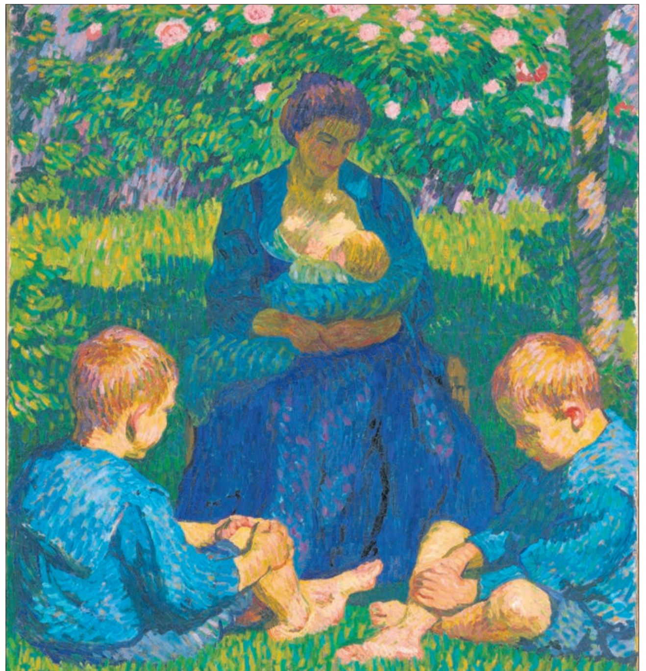
Giovanni Giacometti 1908 - Maternité

telles que le pain, les pommes de terre, le sucre, les petites madeleines croquantes. N'hésitons pas à le dire: Anker se révèle comme un tout grand maître de la nature morte, perpétuant la tradition des peintres hollandais du XVII e siècle.