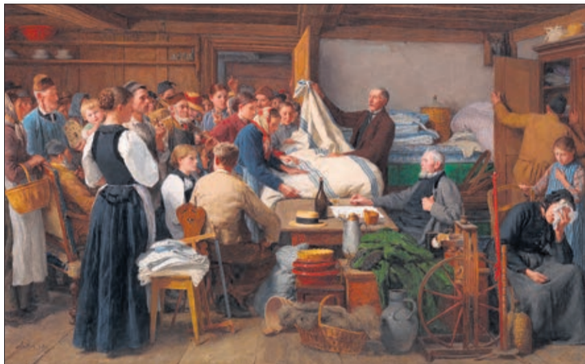
Albert Anker 1891 - La vente aux enchères

pieuse où règnent l'harmonie et la bonté. On a considéré trop longtemps avec un certain dédain cet artiste, qui témoigne pourtant d'une époustouflante virtuosité picturale, et qui était ouvert au progrès et à l'instruction publique. En témoignent ses nombreuses toiles représentant des écoliers et écolières, portant avec gravité leurs livres et leur ardoise. Le monde des enfants était d'ailleurs très cher à Albert Anker, comme celui des vieillards, la plupart du temps des gens simples, des artisans, des paysans. La réalité sociale souvent très dure ne lui était cependant pas étrangère, comme