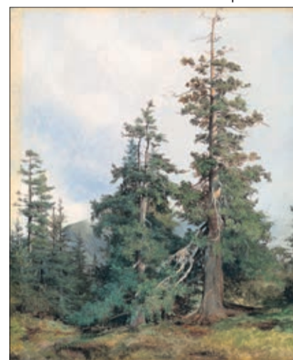
Alexandre Calame - Grands sapins

On l'aura compris, l'art abstrait ou d'avant-garde est totalement loin des goûts et absent de la collection de Christoph Blocher. Celle-ci est en osmose avec sa représentation d'une Suisse rurale et idyllique, voire passéiste. On peut bien sûr discuter ses choix. Mais l'on ne saurait dénier à l'ensemble qu'il a rassemblé une unité et une qualité exceptionnelles.