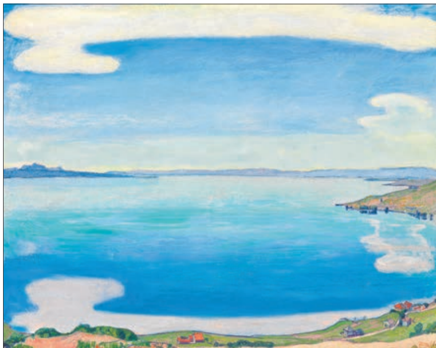
Ferdinand Hodler 1904 - Le lac Léman vu de Chexbres

le montre La vente aux enchères , où une paysanne en pleurs assiste à la dépossession de tous ses biens. Dans La convalescente jouant avec sa maison de poupées, il rejoint la sensibilité touchante de Berthe Morisod et d'Auguste Renoir. On découvrira aussi une facette moins connue de l'œuvre d'Anker, ses natures mortes. Admirateur de Chardin, il a superbement rendu, comme ce dernier, la texture même des objets: pots en verre ou faïences, services à thé de Delft, nourritures