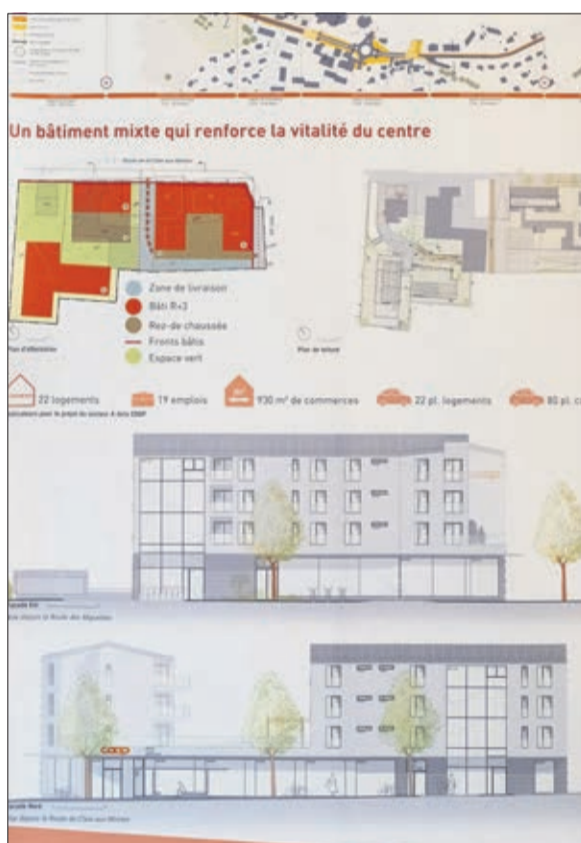
Les deux immeubles qui accueilleront le centre commercial et les locatifs dans leur version définitive

de densité», informent les panneaux exposant le plan d'affectation installés dans le hall de la Maison de commune. On y retrouve en détail la première étape : «Une fois l'autorisation de construire obtenue, une Coop provisoire sera édifiée où se trouve l'actuel terrain d'entraînement de football», souligne la syndique, avant d'ajouter que ce dernier sera déplacé un peu plus au sud. Le supermarché éphémère se tiendra à cet emplacement dès le début des travaux (2022), et ce, durant la totalité des travaux du centre commercial Coop définitif (voir image).