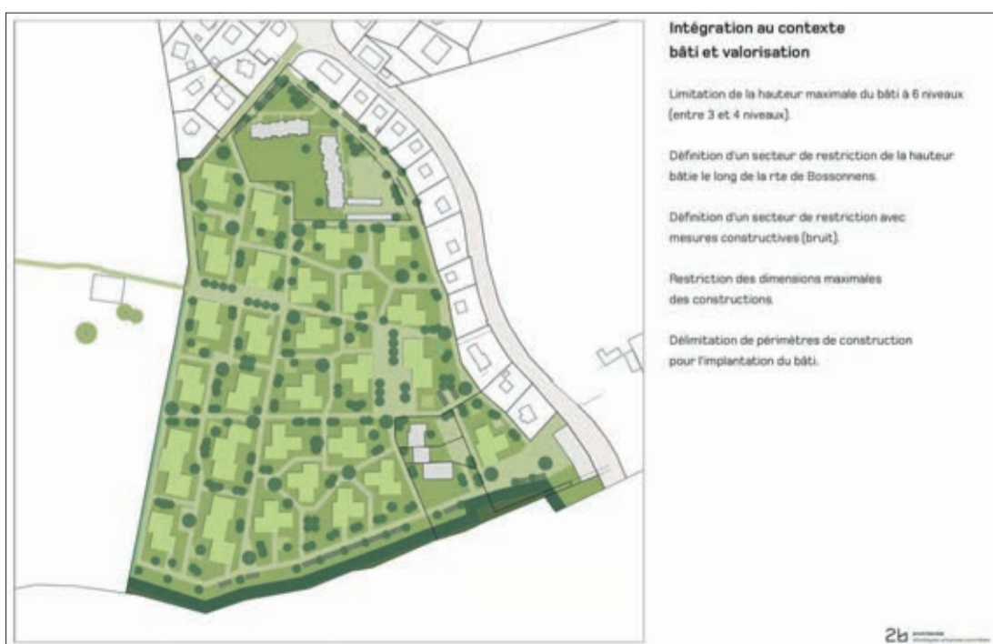
Des mesures phoniques pour limiter le bruit émanant de la route de Bossonnens sont également au programme de cette version du plan de quartier