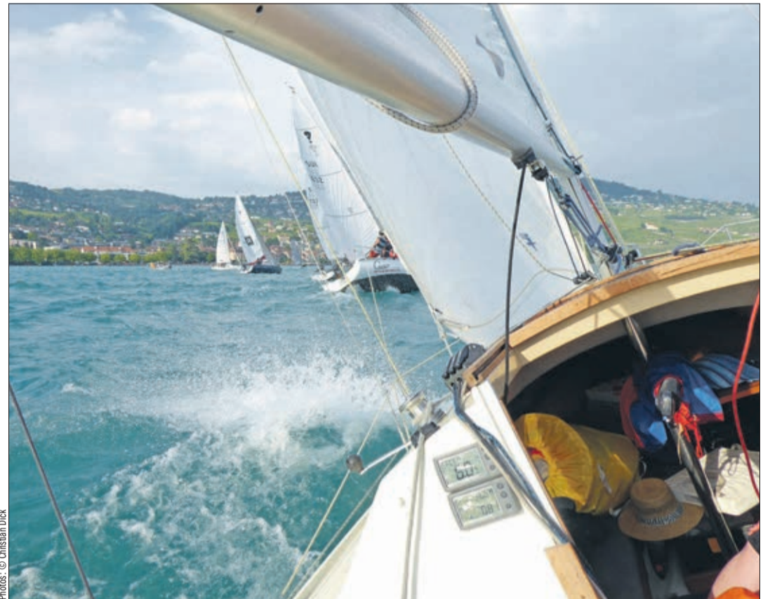
Départ du vendredi

Que le soleil vous accompagne pour un bel été