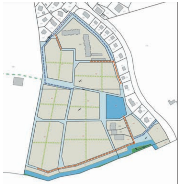
Vision des trois accès en cul-de-sac (en bleu)