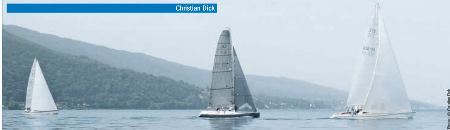
Deux jadis 12 entourant l'Esse 850 Excess