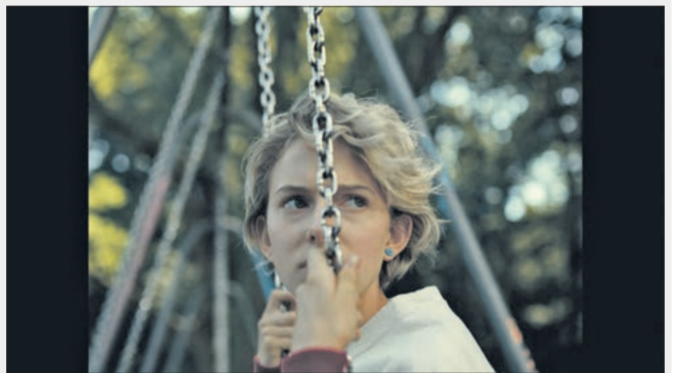
Sami, l'une des trois amies de «Sami, Joe und ich»

«Sami, Joe und ich» de Karin Heberlein, 2020, 94'