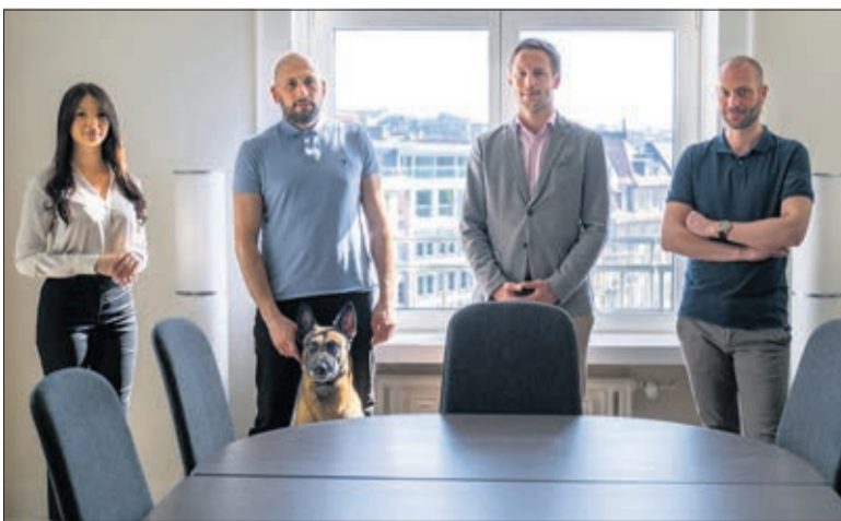
L'équipe de ISC Partners Consulting dans leur bureau, place Bel-Air 1 à Lausanne

A l'occasion de ses 10 ans, ISC Partners Consulting vous offre une évaluation hédoniste pour l'estimation d'un bien immobilier. D'une valeur de 344.- francs, cette évaluation est gratuite en utilisant le code promo « COUR21 » sur le site www.isc.immo/evaluation-hedoniste