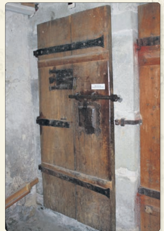
La porte de la prison du château d'Oron