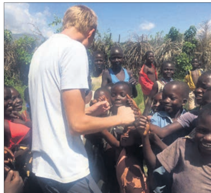
Les enfants d'un village africain accueillant l'équipe de Médecins Sans Frontières