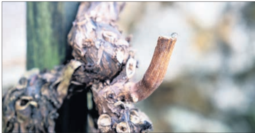
Les chaleurs plus douces et l'arrivée du printemps provoquent une montée de sève pour les végétaux. On dit ainsi que la vigne pleure lorsque des gouttes remontent vers les branches taillées

Si la Saint-Grégoire n'est pas une fête pratiquée à l'extérieur de la commune de Bourgen-Lavaux, l'arrivée des beaux jours et le printemps annoncent qu'il est temps de profiter du patrimoine et du savoir-faire local.