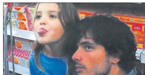
Jouer l'enfant pour attaquer l'ordre familial qui n'inclut pas Jean-Louis

« On dirait le Sud », de Vincent Pluss (2002, 66'). A voir depuis le site du cinéma d'Oron.