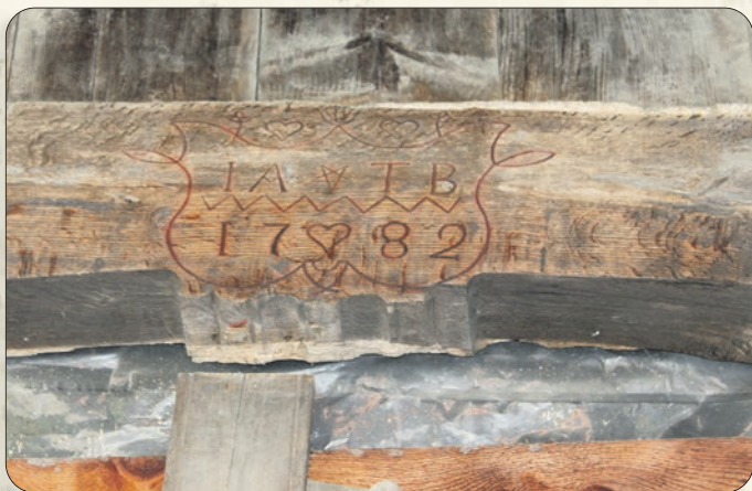
L'inscription au Bois Lederrey