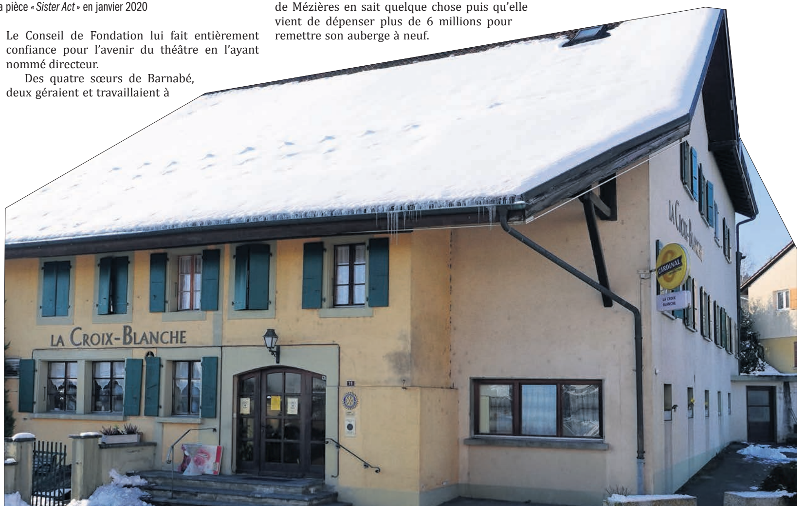
L'entrée de la Croix-Blanche

l'auberge. Elles ne visent qu'à une retraite heureuse, des plus méritées. La pandémie a forcé leur décision. Elles devraient officiellement abandonner leurs activités le 28 février 2021. Les sœurs de Barnabé et leurs descendants n'ont plus rien à voir avec l'héritage si ce n'est que l'une d'elle habite toujours la Croix-Blanche. C'est la Fondation qui a maintenant la lourde tâche de tout gérer! Par la voix de Patrick Oulevay, un membre de la Fondation, qui s'ingénie à le faire de manière harmonieuse en respectant la famille.