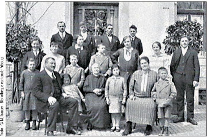
Une famille de 16 enfants des années 1930, époque de la Fondation de Caritas

De nos jours, le couple demeurant en vie pendant de nombreuses années, les générations ne sont plus successives mais concurrentes. D'autre part, le nombre d'enfants naissant dans une famille n'a cessé de décroître: de cinq enfants au XVIII e siècle, dont deux survivaient, on est passé à trois en 1980, voire seulement