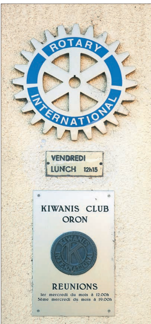
Le sigle des deux clubs service de la Croix-Blanche