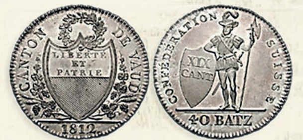
Vaud 40 Batz