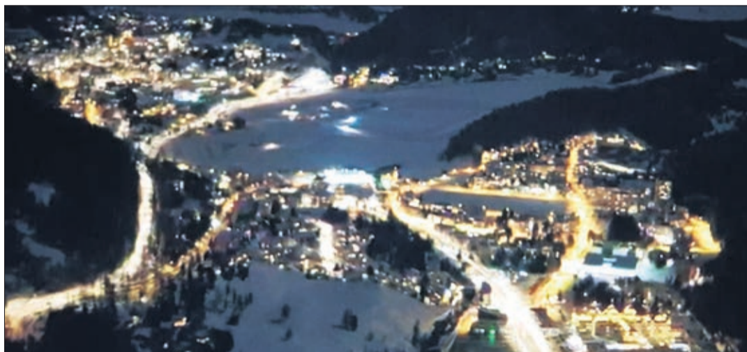
Saint-Moritz, première localité suisse où est apparue l'électricité en 1879