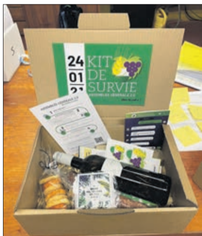
Le kit de survie reçu par tous les participants

Infos: Centrale de la FVJC 079 954 35 25 lucie.theurillat@fvjc.ch