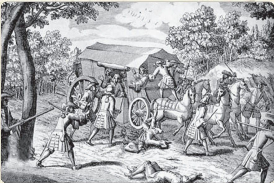
Scène de brigandage

Caporaux et patrouilleurs ne devaient « pas seulement suivre les Villages et les Grands-Chemins, mais ils devaient aussi faire patrouilles dans les sentiers ou autres chemins écartés, de même que dans les bois, en visitant même de nuit les retraites suspectes ». Un « petit livre » visé par les « chefs des endroits où ils passeront » devait être présenté tous les trois jours « à un des Seigneurs Baillifs ».