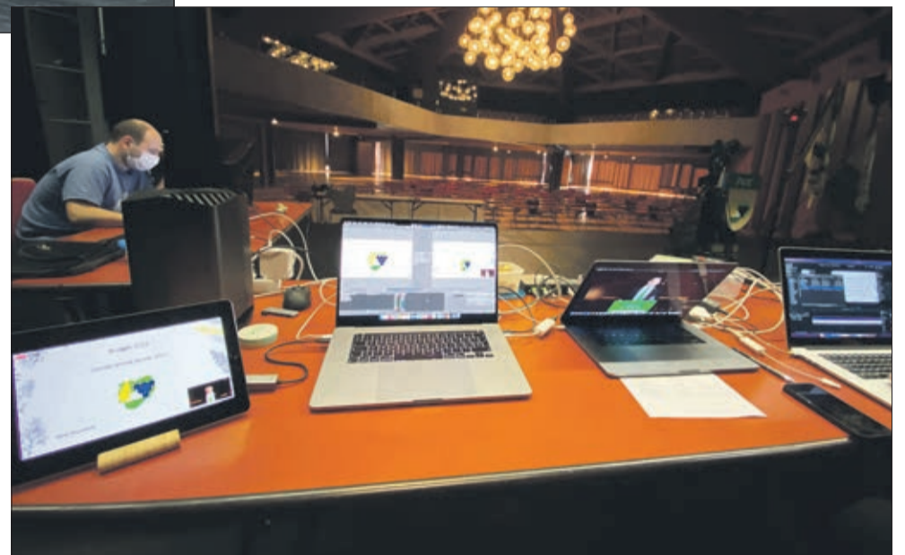
La technologie 2.0 pour pallier aux mesures sanitaires dans la salle du Forum de Savigny vide