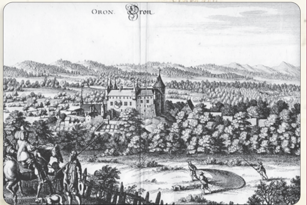
Le château d'Oron - Gravure de 1632, Mérian

ou clédars », les premiers seront « fouettés dans les écoles », « les seconds emprisonné ».