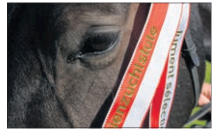
Chicca-Chicca d'Albin portant le titre de jument de sélection