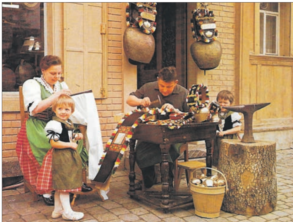
Tout un chacun n'a pas la chance de travailler en compagnie de sa famille

Il arrive parfois que l'esprit se manifeste sur quelque chose d'inattendu, une idée ou un événement à traiter par un article dans le journal. J'ai lu récemment dans un quotidien romand, la réflexion d'une jeune femme qui mérite un peu plus que de l'attention.