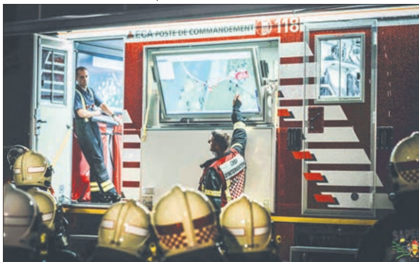
Le poste de commandement