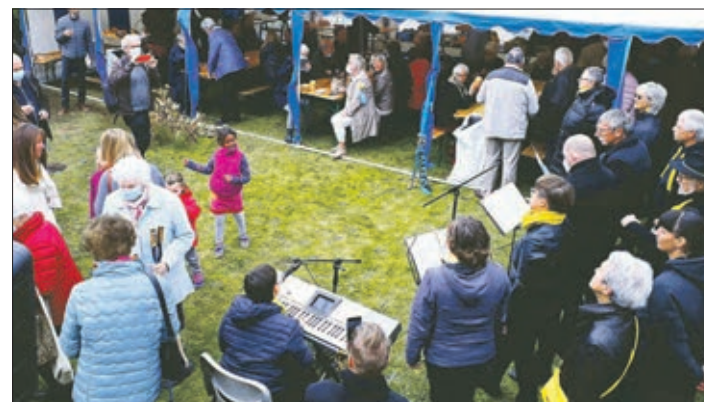
Dans le jardin de la cure

proposé, et plusieurs hôtes préférèrent l'emporter et le savourer à domicile, au chaud et au sec: la météo était décidément par trop inhospitalière!