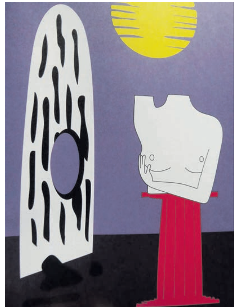
Charlotte Stuby, « Belle de nuit »