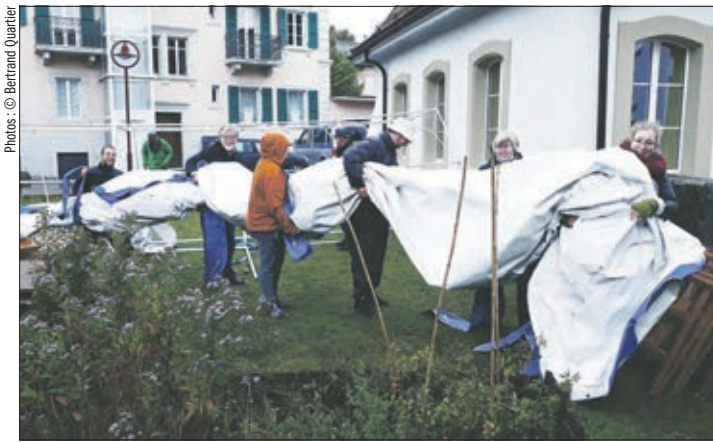
Après la fête, la tempête

Le groupe vocal «Sunday Gospel Singers» anima la célébration et la partie familiale qui s'en suivit entre nuages, coups de vent, pluie et soleil timide. Le même repas que la veille était