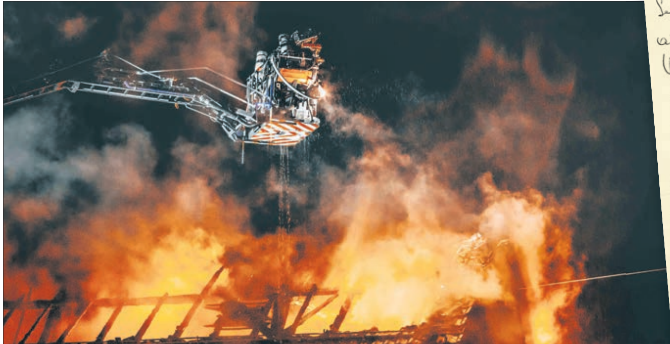
La toiture et une bonne partie d'un bâtiment d'habitation de Puidoux a été ravagé par les flammes

D u 23 septembre au 3 octobre, les pompiers du centre du district sont intervenus à cinq reprises. Entre inondations multiples, sauvetages et incendies, les hommes du Service de défense contre l'incendie et de secours (SDIS) Cœur-de-Lavaux ont connu une grande phase d'activité. Grâce à leur action, une ferme de Forel a été sauvée de justesse des flammes.