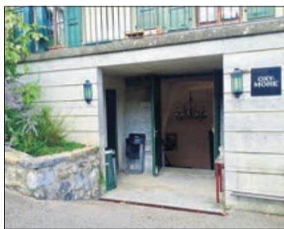
L'entrée du théâtre

Cette période de pandémie affecte bien des secteurs et si l'on parle beaucoup des grandes structures théâtrales, on pourrait se demander ce qu'il en est des lieux plus petits. L'Oxymore, à Cully, en est un avec ses 50 places hors pandémie. Les nouvelles réglementations nous feront peut-être passer à 35 spectateurs, et garder en ordre de marche un théâtre pour 35 personnes c'est une gageure. En admettant que le prix du billet reste le même, et que le personnel d'accueil garde le même salaire, les artistes, eux seront les grands perdants, car il n'existe pas de compensation pour les sièges laissés vides. Certains ont déjà dû renoncer à se produire faute de recette suffisante. D'autres le feront peut-être encore cette année.