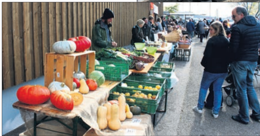
Le Marché du Terroir tel qu'on l'aime

pour les deux prochains rendez-vous des 3 octobre et 6 novembre.