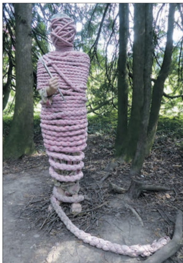
Oeuvre de Nicole Dufour