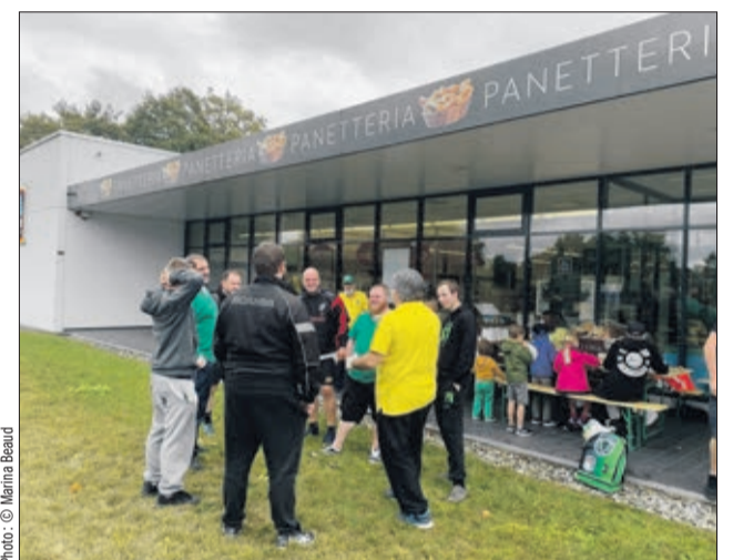
Journée de promotion chez Aldi