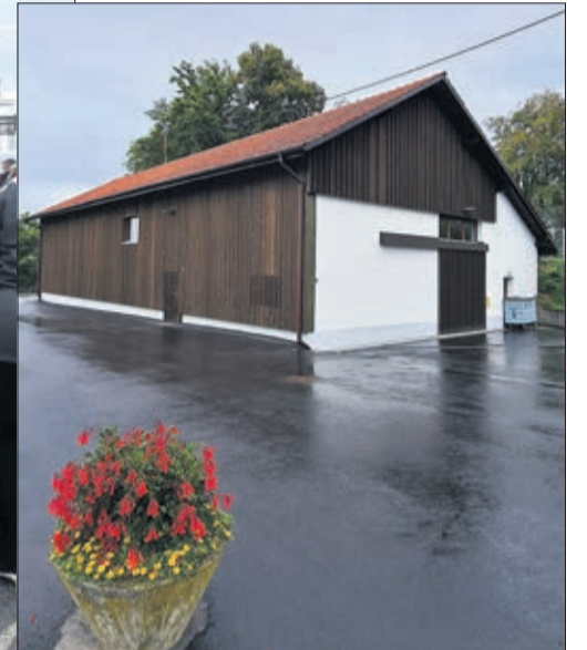
Le battoir a été rénové en 2019

pour les deux prochains rendez-vous des 3 octobre et 6 novembre.