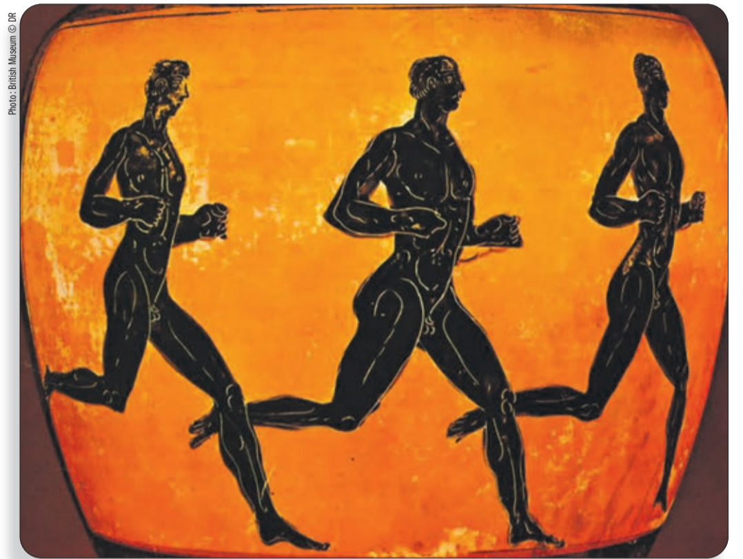
Détail d'une amphore grecque datant de 332 avant JC

Pierre Scheidegger Panathlon-Club Lausanne