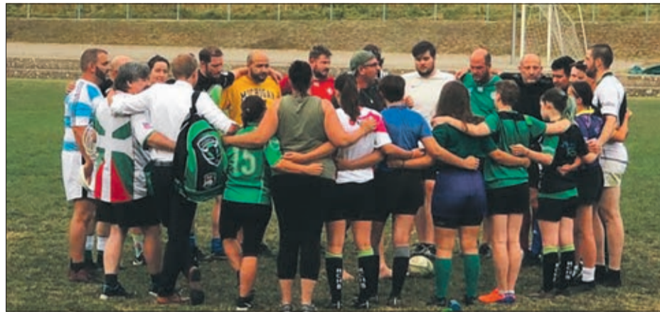
Une soirée d'entraînement à Palézieux