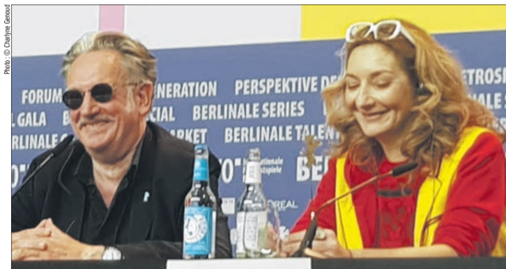
Gustave Kervern et Corinne Masiero à la Berlinale

Tout commence sur la douce musique de Daniel Johnston et une prise de vue de la périphérie française, avec des pavillons coincés entre deux autoroutes. Sortant de nulle part, voici Marie (Blanche Gardin) qui entre dans le cadre de dos pour aller se gratter à un arbre. Or, se frotter à la nature est un acte plutôt rare pour les personnages de ce film qui se débattent dans le monde construit par l'homme. Là où ils habitent, la nature est bétonnée et encadrée. Le seul coin de verdure dont les protagonistes sont proches, c'est le rond-point plein de souvenir où ils ont manifesté du temps des gilets jaunes. Alors qu'ils se remémorent ces moments ensemble, ils affichent une triste mine de déception. Comme un deuxième combat, les trois pro-