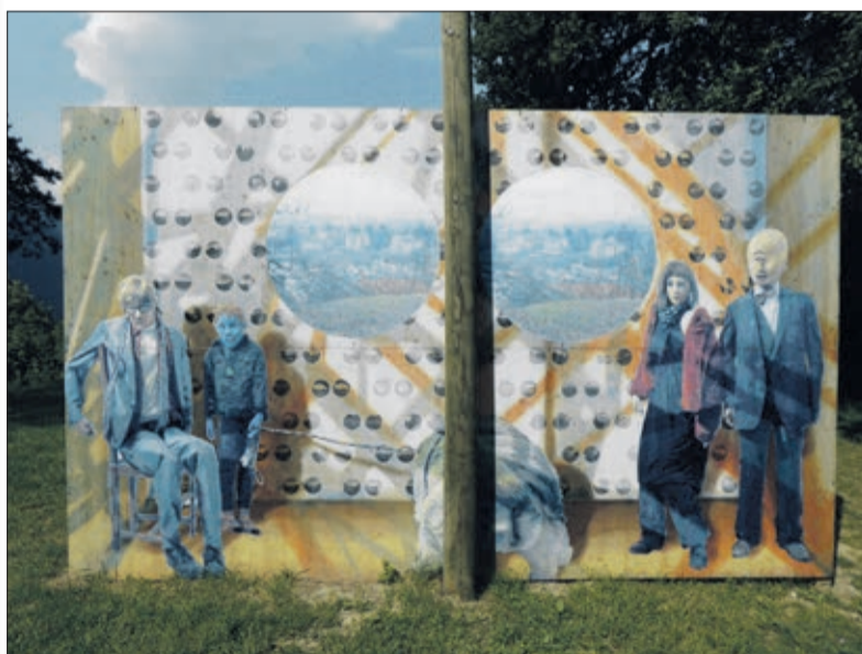
Peinture de Jonathan Delachaux