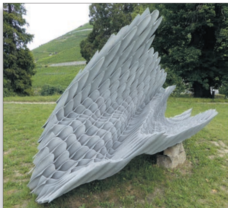
Sculpture d'Andrea Wolfensberger