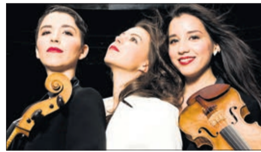
Trio Söra, interprète Beethoven

Dans la lignée des précédentes éditions, le festival off fera la part belle aux jeunes talents de la région. La majorité des concerts bénéficiera de l'espace et de l'ouverture sur le lac de la magnifique place d'Armes de Cully. Ce choix