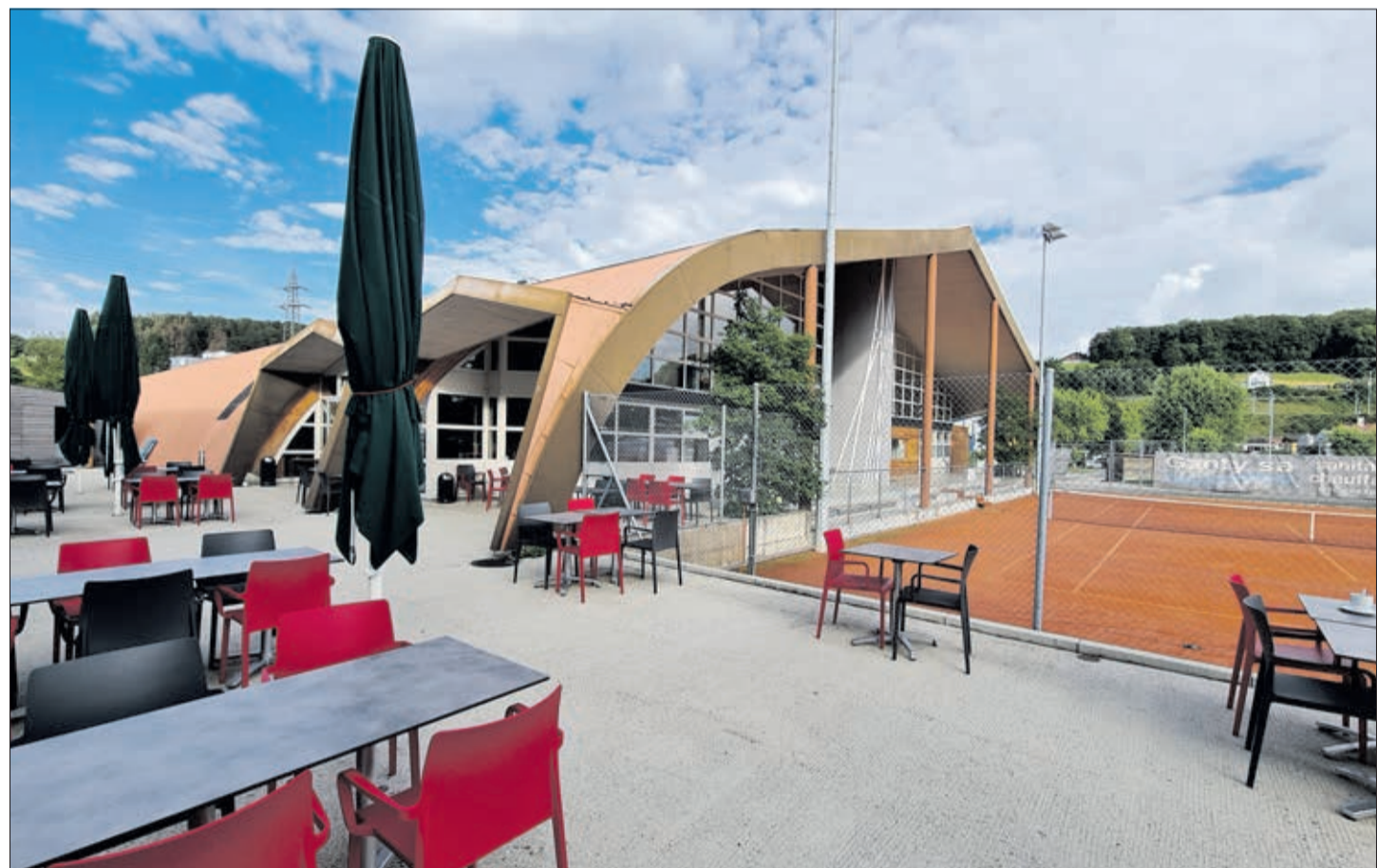
Courts extérieurs et la terrasse du restaurant