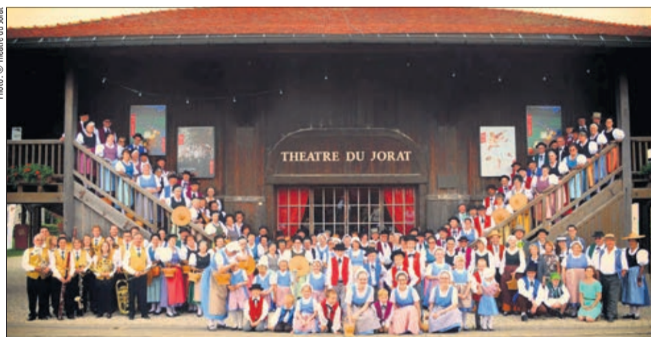
Les 28 et 29 mai 2016, le Théâtre du Jorat avait accueilli les 100 ans de l'Association cantonale du costume vaudois, une proximité qui semble venir d'un autre monde

Pour sensibiliser le grand public à la problématique traversée par le secteur, une action de solidarité est lancée simultanément dans toute la Suisse. Intitulée « Night of Light », son objectif est d'engager un dialogue avec les décideurs politiques afin d'attirer l'attention sur les milliers d'emplois menacés par la crise. Réunissant de