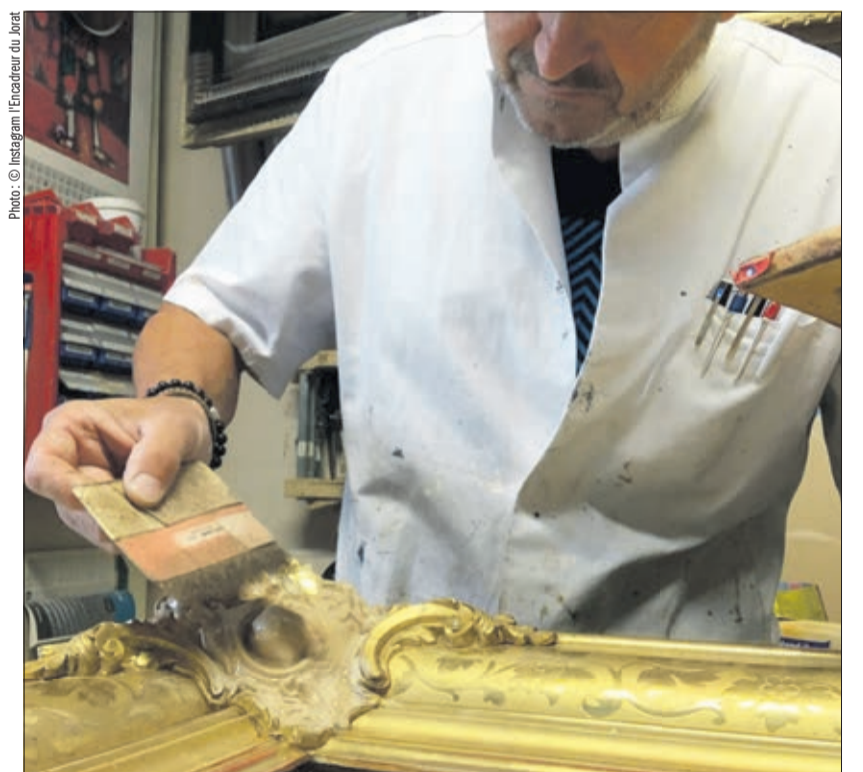
Pose de la feuille d'or sur un cadre