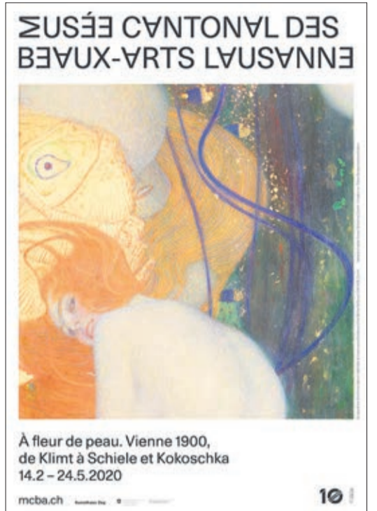
À fleur de peau. Vienne 1900, de Klimt à Schiele et Kokoschka 14.2 - 24.5.2020 mcb.ch

sinés par Otto Wagner lui-même, pour le bâtiment très moderne de la Caisse d'épargne de la poste à Vienne (1904), dont il fut l'architecte. Les meubles, toujours sobres, aux décors géomé-