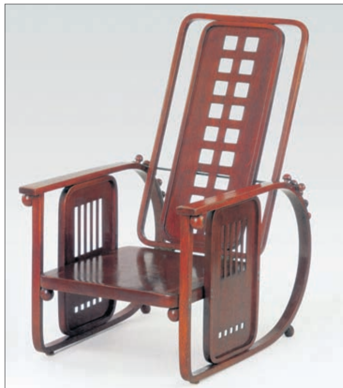
Josef Hoffmann, Exécution : Jacob & Josef Kohn, Vienne Fauteuil à dossier inclinable, dit «Sitzmaschine», modèle produit dès 1906

Même si la visite du premier étage requiert une attention soutenue, on ne manquera pas de parcourir le second. Il illustre bien la volonté des Sécessionnistes d'englober tous les espaces de la création, artistique ou artisanale. Leur but est de créer pour les objets un style nouveau, fonctionnel, confortable et hygiénique. En cela, ils sont les prédecesseurs du Bauhaus des années 1920-30, et de Le Corbusier. Particulièrement intéressants, les meubles des-