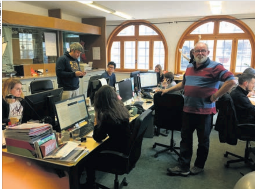
Grises mines au staff du Cully Jazz ce lundi

Comme toute manifestation, le Festival a la responsabilité d'assurer la protection de la santé du public, des artistes et de ses bénévoles. Dans ce contexte et malgré tous leurs efforts, les organisateurs ne sont simplement plus en mesure d'offrir des rencontres de qualité qui répondent aux recommandations du Conseil fédéral et aux exigences sanitaires et sécuritaires, ni même d'assurer un futur au Festival.