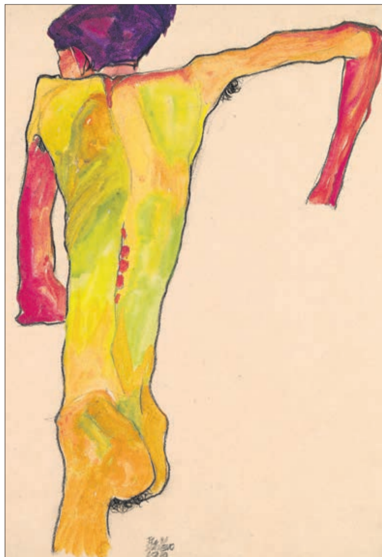
Egon Schiele, Nu de dos, prenant appui sur ses bras (Sich aufstützender Rückenakt), 1910

une belle série de lithographies inspirées par l'art japonais. Quant aux dessins de Klimt, ils reflètent l'érotisme qui habite toute son œuvre. Il ne craint pas de montrer une femme se livrant à son plaisir solitaire. Certes, on ne s'attendra pas à voir au MCBA ses tableaux les plus connus, comme le célèbre «Baiser».