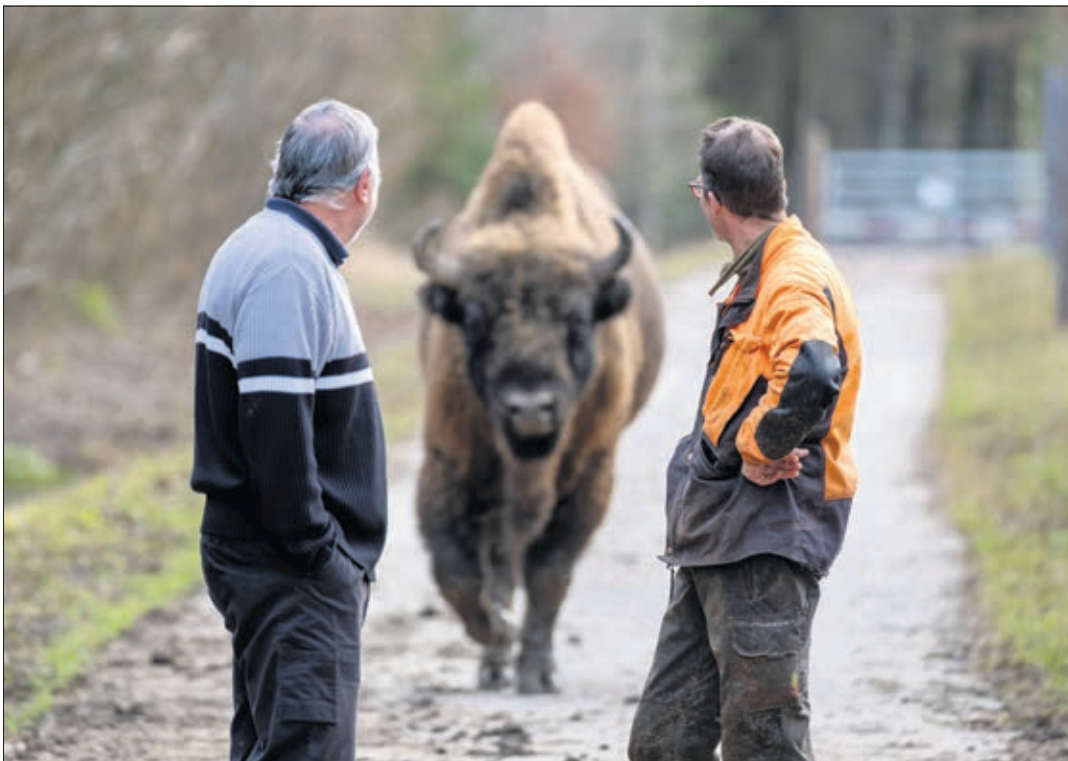
Les gardes forestiers attendent la venue de Poset II, le mâle bison

Ces enclos sont grillagés du sol jusqu'à environ un mètre huitante. Une fois la quarantaine levée, le grillage sera mis en hauteur