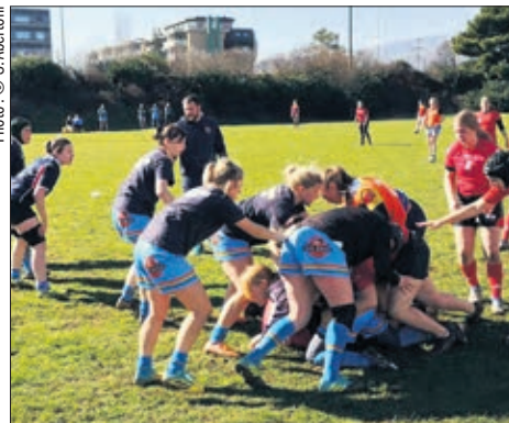
Les Mermigans face à l'élite