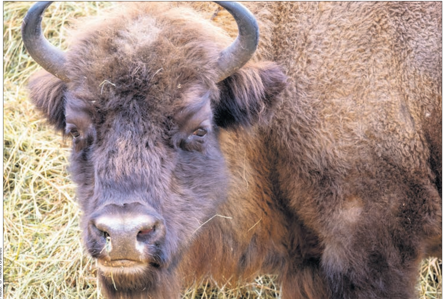
Le seul mâle du parc, Poset II

afin de permettre aux animaux sauvages comme le renard et le chevreuil de cohabiter avec le bison. De plus, les parcs présenteront une surface agrandie à environ 50 hectares chacun.