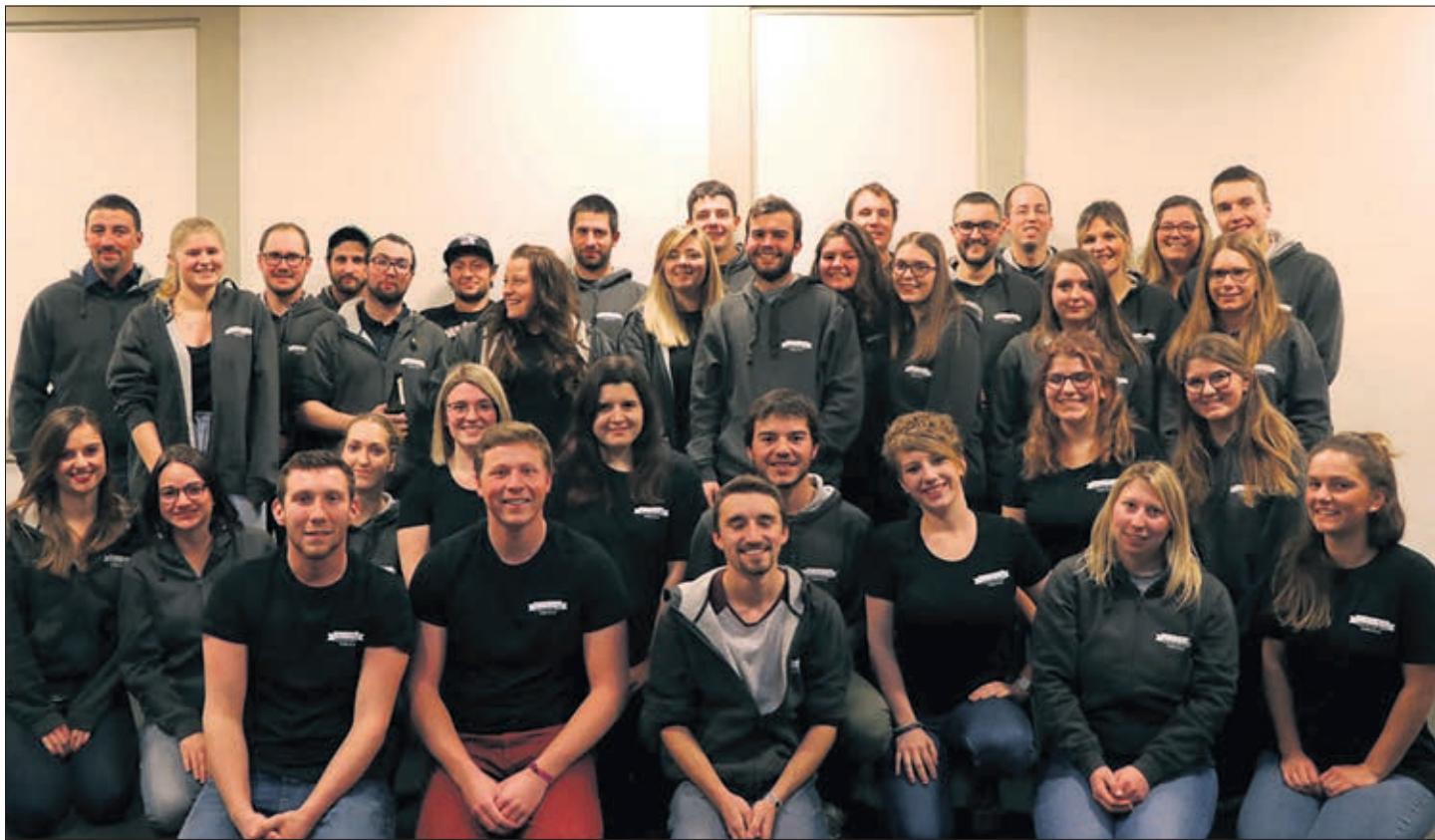
Les gentilshommes et les gentes dames de la Jouvence de Poedoux en 2020!

Tous les renseignements complémentaires sur l'organisation se trouvent sur: www.puidoux2020.ch