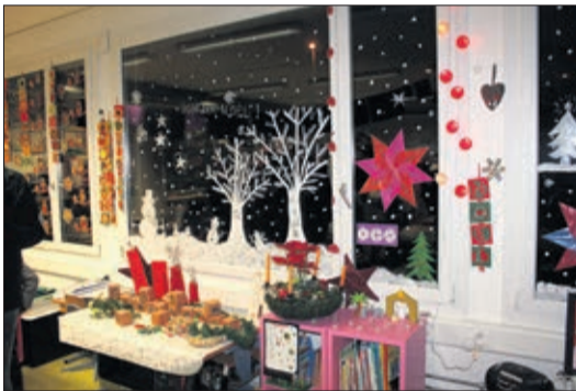
Les décorations créées avec les enfants