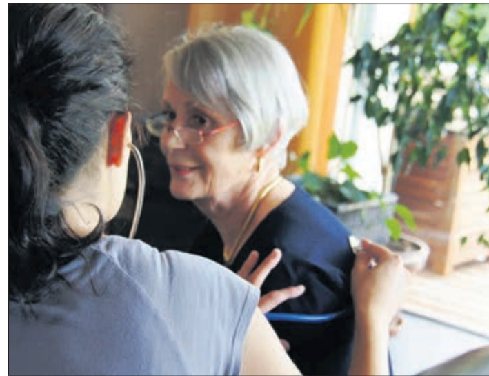
AVASAD, aide et soins à domicile - soins infirmiers

Dans une enquête faite par l'AVASAD auprès de ses employés, 70% d'entre eux sont insatisfaits des mesures prises pour le bien-être au tra-