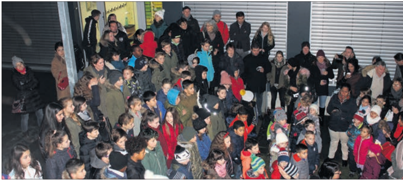
Les voix enfantines ont réchauffé la nuit

Tout comme l'îlot (accueil parascolaire), et la Ludothèque, les maîtres et maîtresses des 7 classes de 3P à 8P, du pavillon scolaire ont fait le choix de participer aux Fenêtres de l'Avent, soutenus financièrement par le Conseil d'établissement qui a permis la réalisation des jolies décorations faites avec les enfants et l'organisation d'un apéritif aux senteurs de cannelle et autres épices de saison qui embaumaient les lieux. Chacune des salles avait son thème de prédilection. Dans l'une, pères Noël et étoiles