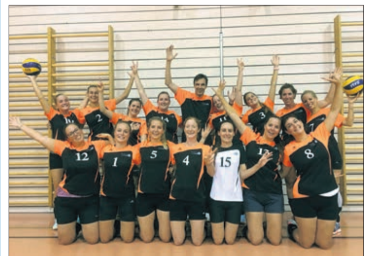
Equipe de 4 e ligue féminine A