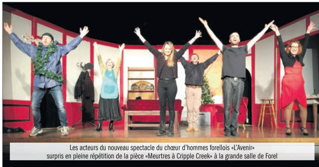
Les acteurs du nouveau spectacle du chœur d'hommes forelois «L'Avenir» surpris en pleine répétition de la pièce «Meurtres à Cripple Creek» à la grande salle de Forel

Dès sa sortie, la pièce a recueilli des échos très favorables dans la presse. Jugez plutôt: «Un spectacle très réussi, réjouissant, idéal réchauffer un soir d'hiver!» sourtiraparis.com , «Ce huis-clos policier mêle avec malice suspense, comédie et drôlerie» top-parent.com , «Au théâtre c'est parfois comme au cinéma: on reste bouche bée à regarder les scènes défilier sans pouvoir décrocher l'écran – pardon la scène – du regard!» culturezvous.com , «C'est un petit bijou référentiel mais aussi très moderne qui vous prend et vous captive pendant toute la durée de cette enquête décalée» lemague.net .