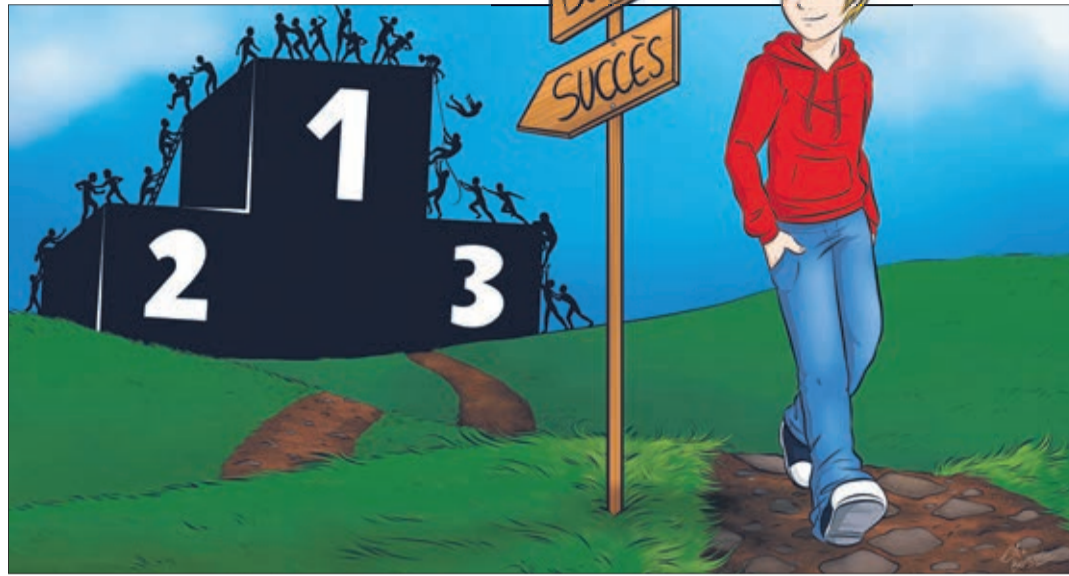
Dessin: © Elsa Bersier

assisté en ce dimanche des Rameaux à l'église de Palé-