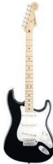
Fender à Eric Clapton, Blackie