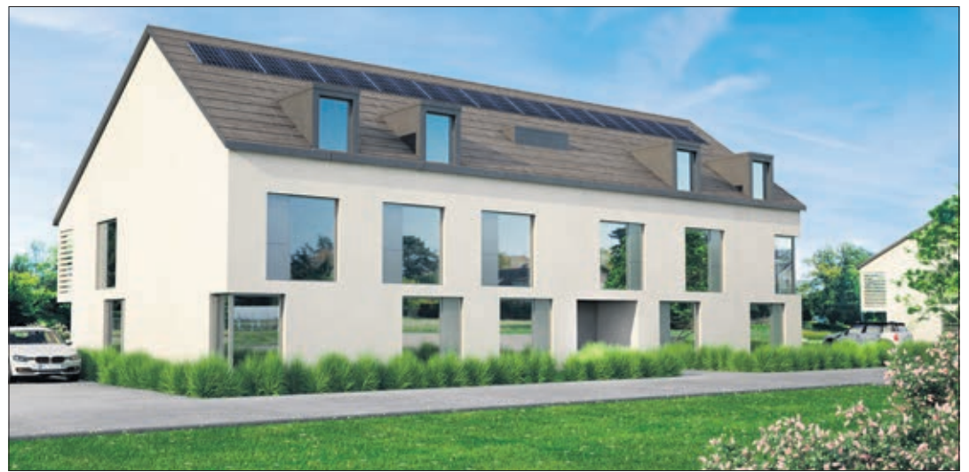
Immeuble côté village

en mars 2015, comprenant quelques petites dérogations. Face aux oppositions, ce projet a été retiré, pour être soumis à nouveau, en septembre 2015, à enquête sous forme de 3 dossiers distincts et conformes aux règlements en tous points, sans dérogations: 1 groupe de 5 immeubles, 1 immeuble sur la partie nord de la parcelle et une servitude publique entre la laiterie et la gare. Une nouvelle fois des oppositions basées sur la perte de vue, la volumétrie des bâtiments, le manque de sécurité par rapport à l'accès à la route, la disparition des places de parc pour les habitants de la Villageoise, entretemps recrées aux abords de ce bâtiment, etc., ont entravé cette réalisation.