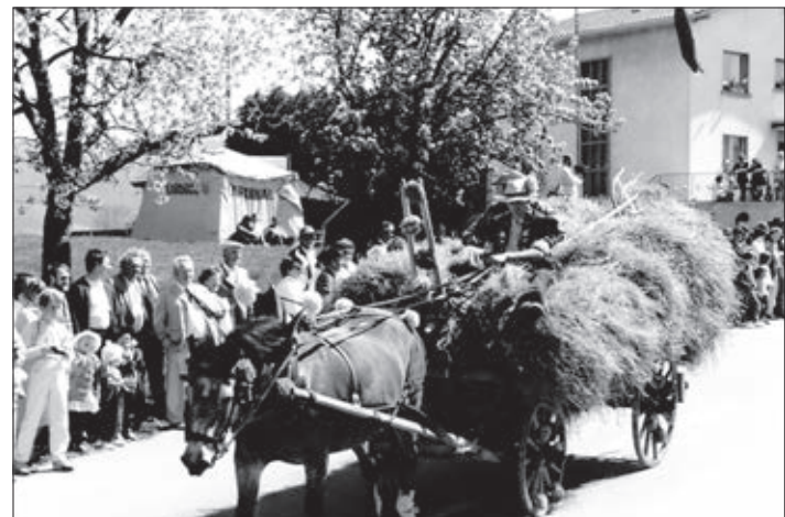
Un paysan qui fut très applaudi lors d'un cortège