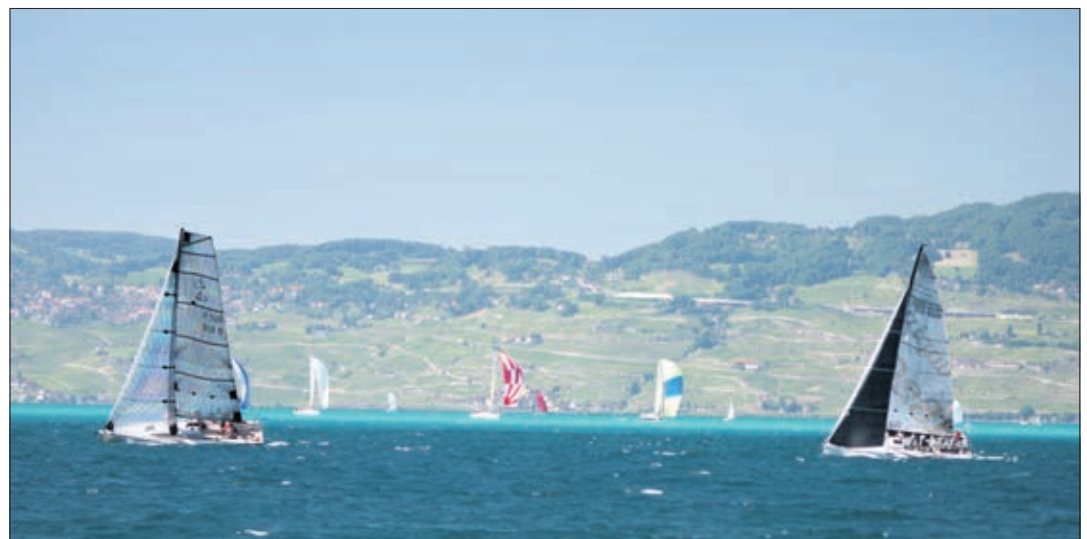
Deux monocoques au premier plan, d'autre au 3e plan et le Lavaux en fond