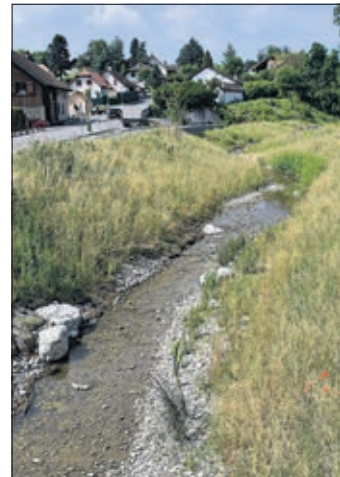
... et après