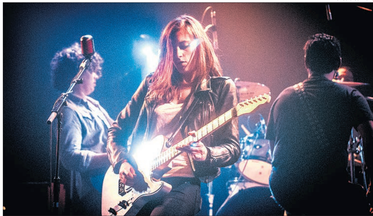
The Laura Cox Band

Infos et programme sur www.rockobattoir.ch https://www.facebook.com/RockObattoir/