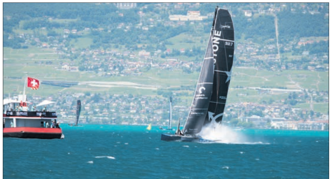
Un trimaran qui est entrain de passer la bouée