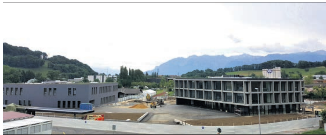
Les deux nouveaux collèges Verney A et Verney B pratiquement terminés

Les autorités responsables de la construction des collèges Verney A et Verney B et de la salle de sport VD6 Le Forestay ont pédalé ferme pour faire aboutir ces projets importants dans un temps relativement restreint pour accueillir les élèves et les enseignants à la rentrée d'août 2017-2018.