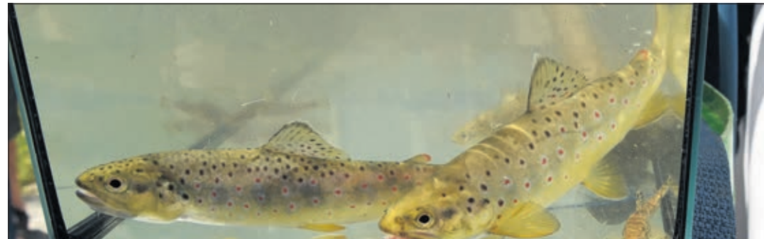
Parmi de nombreuses espèces de faune aquatique présentes dans cette nouvelle partie du ruisseau, de très belles truites fario mesurant près de 25 centimètres ont déjà trouvé résidence à leur goût. Elles seront immédiatement remises à l'eau après leur présentation au public