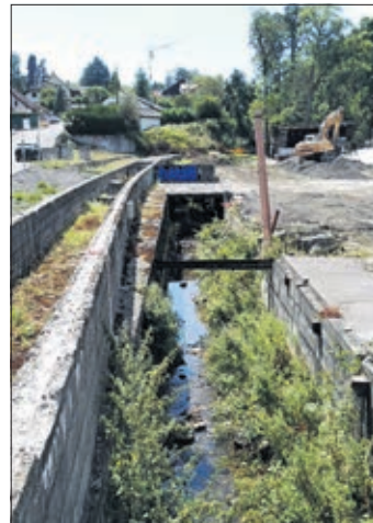
Le cours du Flon avant...