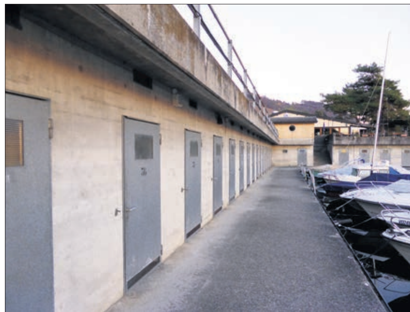
Les cabines de Moratel

- Elle nous a déjà menés à nous retrouver. C'est pas mal, non?