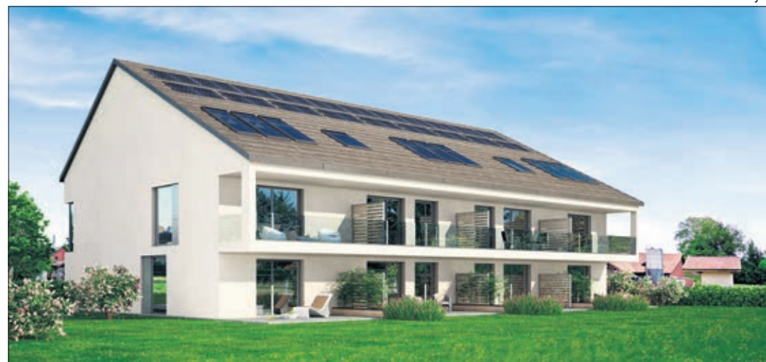
Immeuble côté Broye