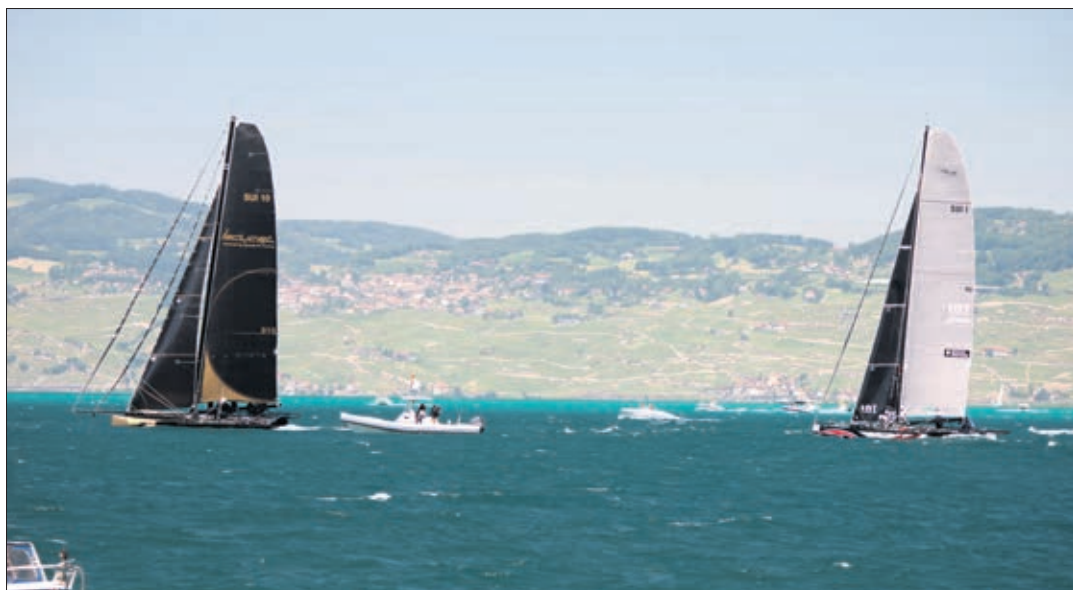
Ladycat Powered by Spindrift Racing (premier du classement en 13:03:31), Dona Bertarelli