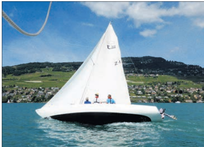
Régate à la Pichette, 2016

L'après-midi sera consacré à une burger party réunissant au cercle navigateurs et amateurs après l'épreuve. L'événement de taille est