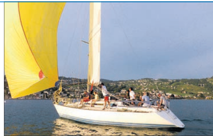
Virus à la P'tite semaine du soir, Pully 2016

Le CVMC a lui aussi commencé sa saison, d'abord, comme les autres clubs, par un cours start lors d'une assemblée des régatiers. Les principaux changements résident davantage dans une réécriture de texte pour le rendre plus accessible. Une modification importante concerne le contournement des bouées, la fameuse «règle 18.3» qui ne s'appliquera désormais plus qu'au passage des bouées laissées à babord. Une autre modification de taille est celle qui implique un voilier fautif même s'il n'est pas en course. Il pourra être pénalisé. Cette règle concerne «ceux qui n'ont rien à faire là» lors de starts successifs, par exemple une ligne de Toucan, dans une procédure de départ, suivie à cinq minutes d'une autre de