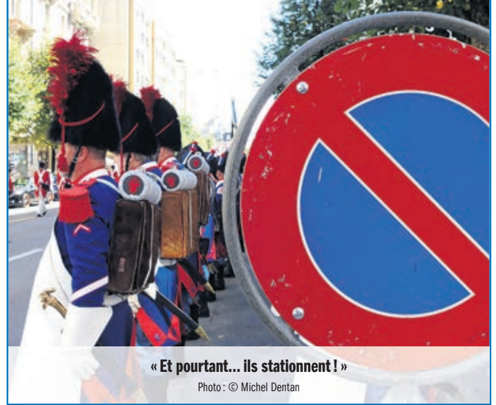
« Et pourtant... ils stationnent ! »