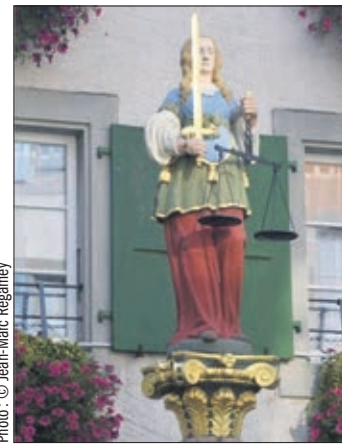
Statue de la Justice, Cully

Un nonagénaire me disait récemment qu'après la germination, il y a la croissance. Et quand les racines ont poussé en profondeur, la plante du bonheur devient un arbre impérissable et fécond pour l'être humain. Pour soi et pour les autres, la justice sociale peut aussi être comparée à une plante dont la semence se doit d'être cultivée dans une terre propice à l'épanouissement de tous ceux et celles qui vivent proche de l'indigence.