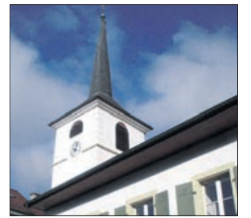
Clocher et salle St-Théodule

propos du foie gras: La technique du gavage remonte à l'époque des Egyptiens de l'Antiquité qui ont commencé à gaver les oiseaux pour les engraisser; la consommation de foie gras proprement dit a été signalée pour la première fois dans la Rome antique.