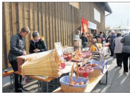
Les bancs du marché