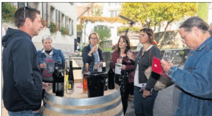
Ambiance autour d'une dégustation de vins de Rivaz