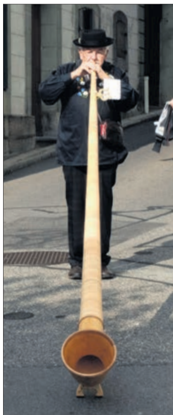
Ambiance autour d'une scène médiévale