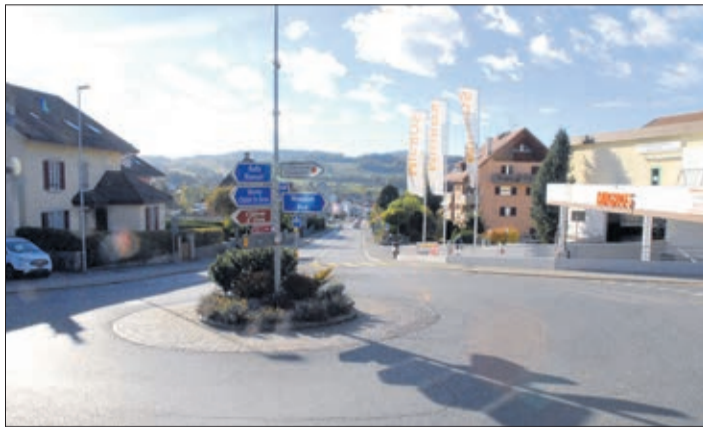
La route de Lausanne et à droite le début de la route de Moudon

Pour se soumettre aux normes fédérales et aux renouvellements des infrastructures, la Municipalité a décidé de moderniser drastiquement la route de Lausanne depuis l'entrée de Landi jusqu'au rond point de la Migros ainsi que la route de Moudon jusqu'à la jonction fribourgeoise.