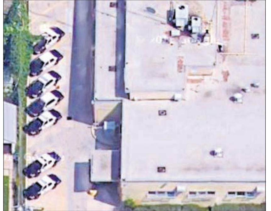
Police à 6929 W Silver Spring Dr, Milwaukee, WI

L'officier de police sortit. Le temps parut long. Amanda, Cordey et Parisod se demandèrent s'il ne s'agissait pas d'une blague ou d'une méprise. Mais l'ex-inspecteur les exhorta à la patience. Selon lui, le commissaire américain n'était pas du genre comique. Il revint une bonne heure plus tard.