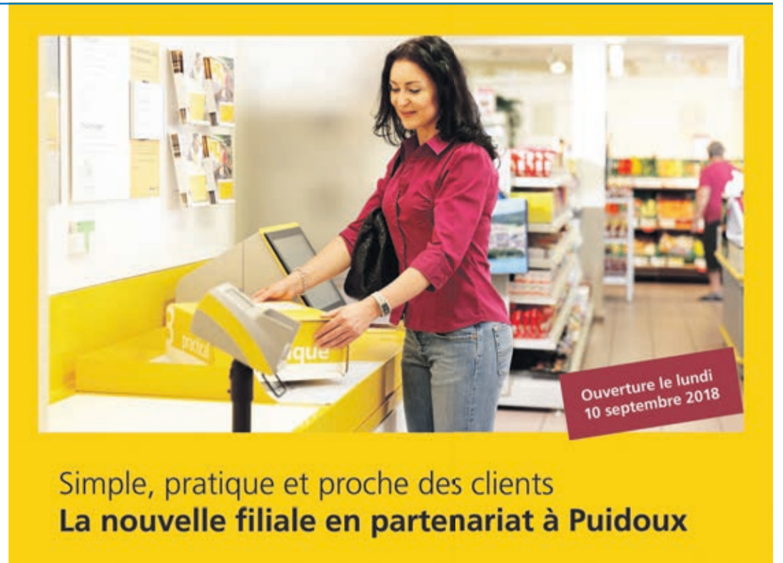
Simple, pratique et proche des clients La nouvelle filiale en partenariat à Puidoux