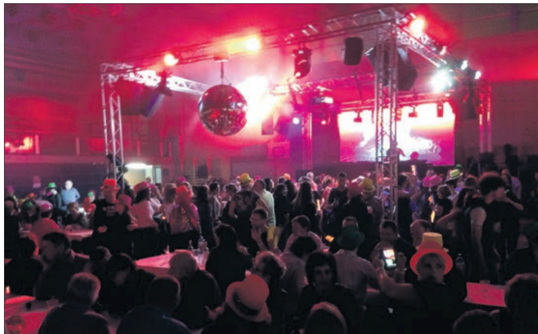
Du pink fluo pour démarrer en... douceur

La réponse, cela fait déjà six ans que le club de lutte de la Haute-Broye l'a trouvée avec succès. Pour preuve: l'édition 2018 a encore une fois battu son plein. Il a même fallu