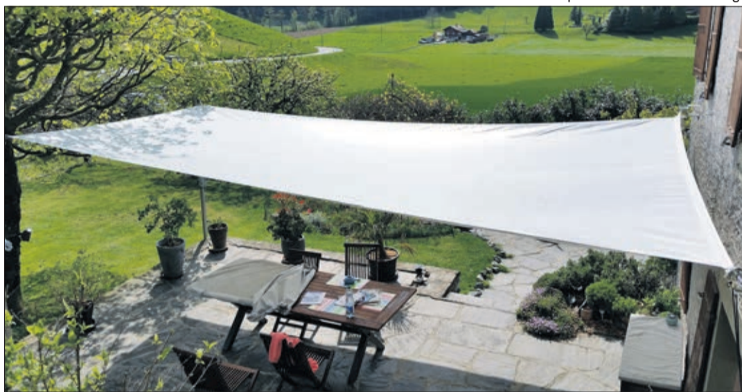
L'atelier fabrique aussi des voiles d'ombrage

L'atelier de voilerie et sa table de 18m