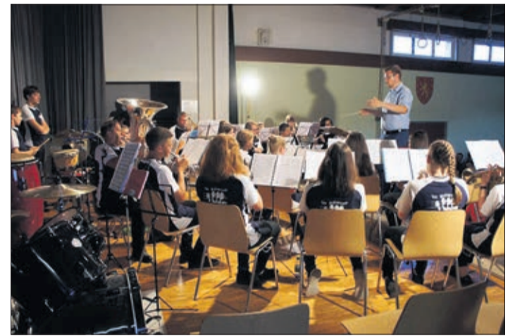
L'Ecole de musique de L'Harmonie d'Oron (les Cops) jouaient en première partie du concert de L'Harmonie d'Oron en début décembre

Une journée portes ouvertes aura lieu le samedi 19 mai de 9h à 12h au collège d'Oron. Des petits concerts seront joués par nos élèves et professeurs et vous aurez également l'occasion de tester tous les instruments que vous souhaitez. L'Harmonie d'Oron