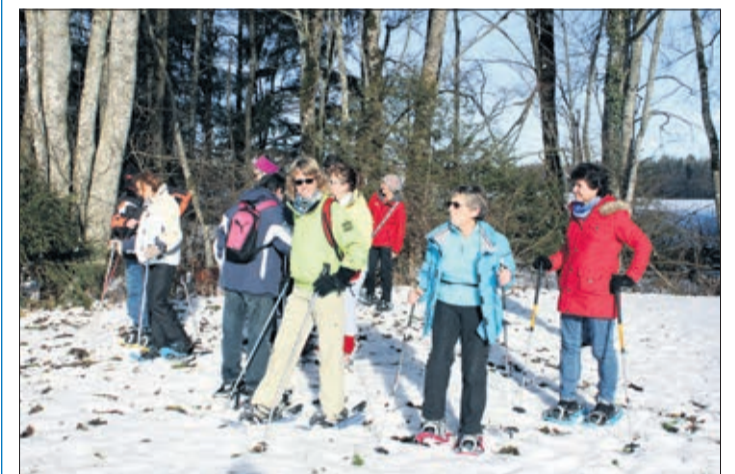
La pause apéro

Illustration: L'affiche du spectacle dessinée par Caro (Caroline Rutz) www.carotoons.ch