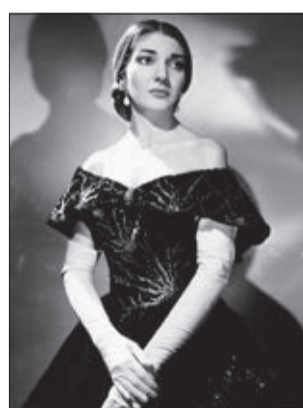
Maria Callas dans le rôle de Violetta au Royal Opera House de Londres (1958)

A sa voix d'exception, son intelligence vive, son sourire à fendre les coeurs, s'ajoutait une générosité sans bornes.