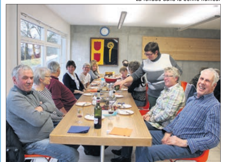
La fondue dans la bonne humeur