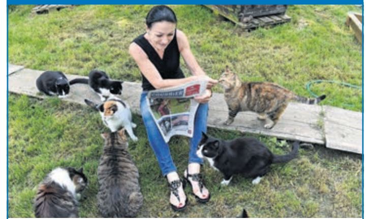
« Le Courrier: un large cercle d'intéressés »

Vous aussi, envoyez vos moments volés à: redaction@lecourrier-lavaux-oron.ch