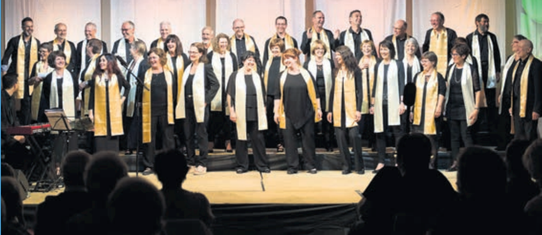
Le chœur mixte La Pastourelle de Cheyres

Le temps de l'Avent est propice au recueillement; il nous invite aussi au partage. C'est dans cet esprit que nos deux ensembles, le chœur mixte La Pastourelle de Cheyres et l'orchestre de chambre de la Broye, invitent chacun à entrer en musique dans l'esprit de Noël.