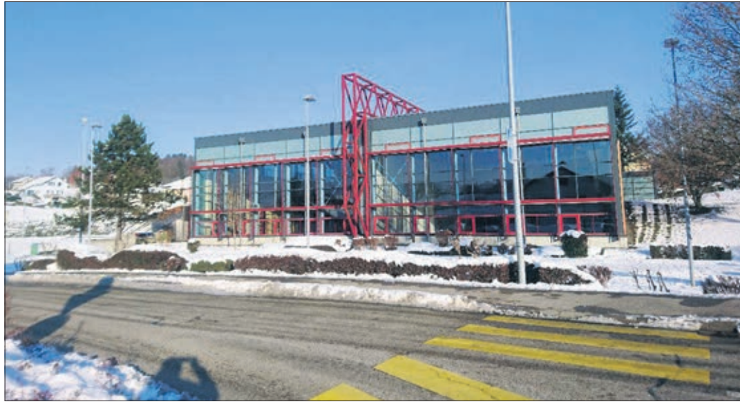
Le Centre sportif d'Oron

Encadré par l'article 33 de la LEO, le CET participe à l'insertion de l'établissement dans la vie locale. Constitué par différents maillons de la société, il appuie l'ensemble de ses acteurs à la réalisation de leurs missions en relation avec l'établissement. Le bien-être de l'enfant-élève est la raison d'être