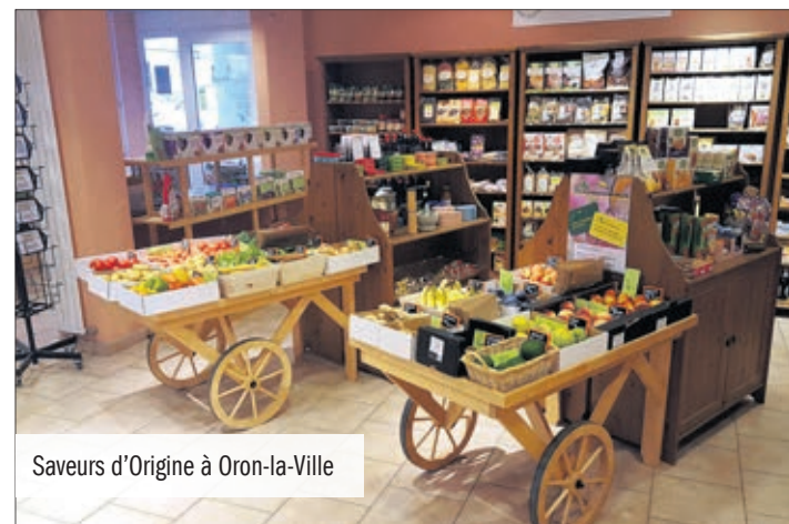
Saveurs d'Origine à Oron-la-Ville