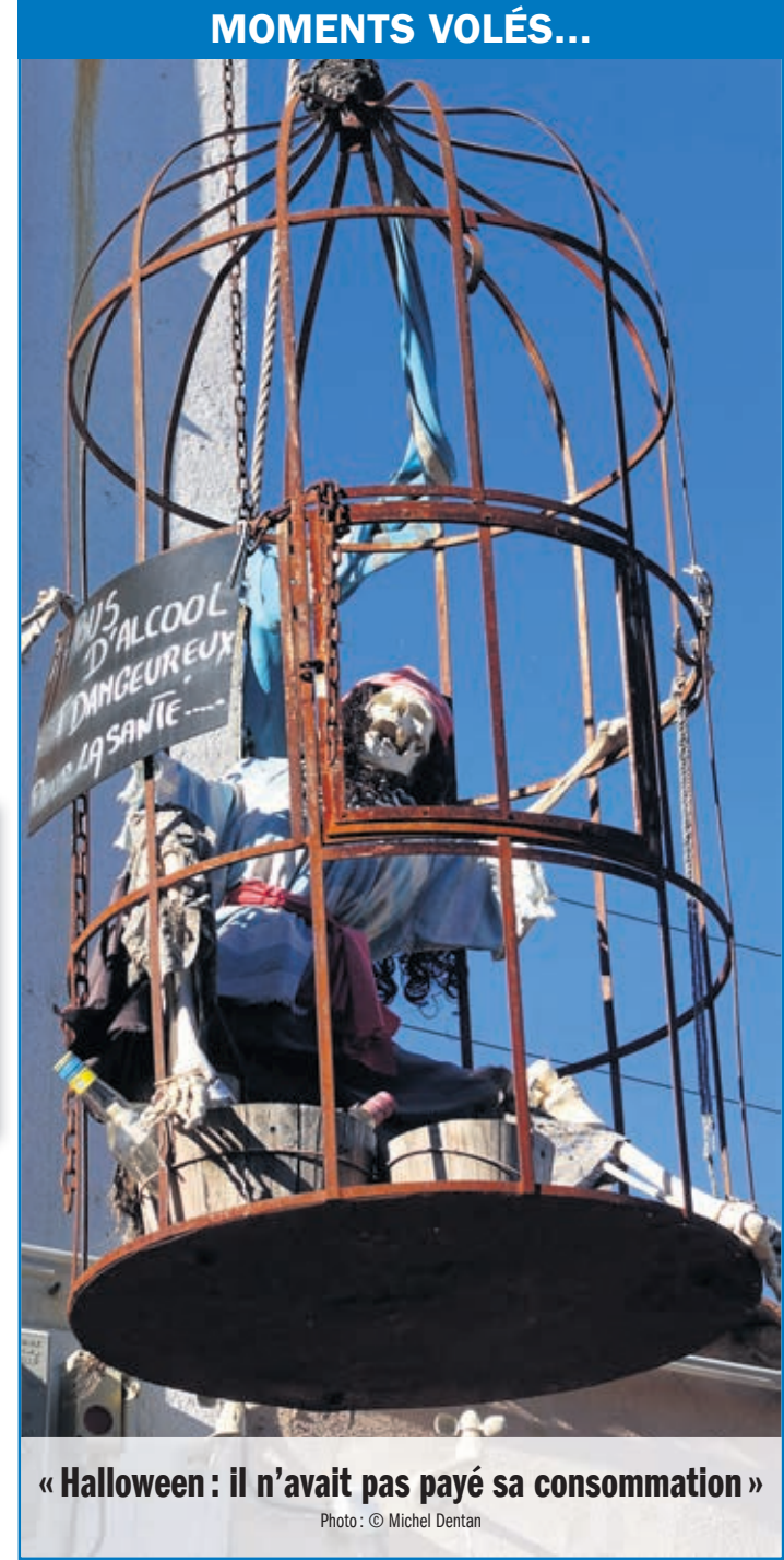
« Halloween : il n'avait pas payé sa consommation »