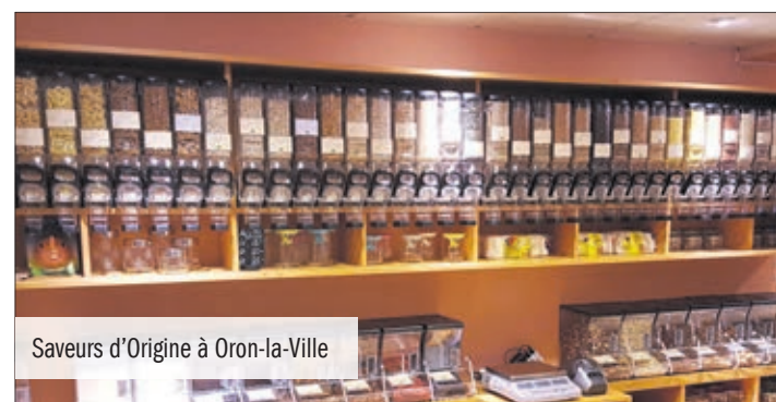
Saveurs d'Origine à Oron-la-Ville