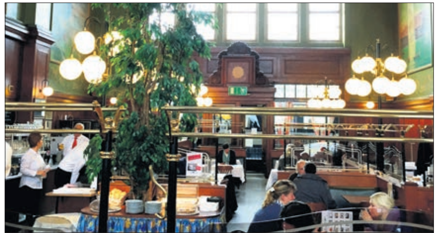
Buffet de la Gare à Lausanne

- Avec plaisir, avait-il répondu. Il lui semblait qu'il s'était senti maladroït. Du pied peu marin comme du cœur mal expérimenté. Mais sa vie n'avait-elle pas attendu ce moment depuis longtemps? Le moteur du canot démarra. Amanda défit les amarres. Ils sortirent paisiblement du port sous l'œil amusé, curieux ou admiratif des promeneurs. Ils prirent lentement de la vitesse. Cordey apprécia le bruit du clapot contre la carène, le doux ronronnement du moteur. Après quelques minutes le canot ralentit et s'immobilisa à bonne distance de la rive. - Avez-vous une bouteille? demanda la conductrice. Cordey la regarda avec étonnement. Elle sortit de son sac une chopine de vin blanc entourée de sa protection thermique avec deux verres qu'elle remplit adroitement. Elle en tendit un à l'inspecteur. - Ça m'étonnerait qu'un supérieur vous voie ici, dit-elle en souriant. A votre santé! - Santé! fit l'inspecteur. - Moi, c'est Amanda. - Je préfère qu'on en reste dans les politesses d'usage, étant donné la situation. Mais merci. J'apprécie.