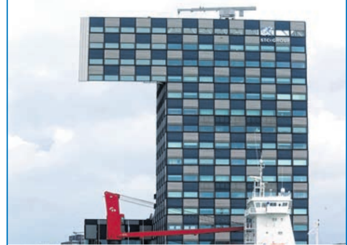
«Sujet au vertige s'abstenir!»

Vous aussi, envoyez vos moments volés à: redaction@lecourrier-lavaux-oron.ch