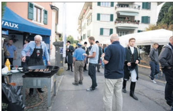
Un stand de brochettes et les passants