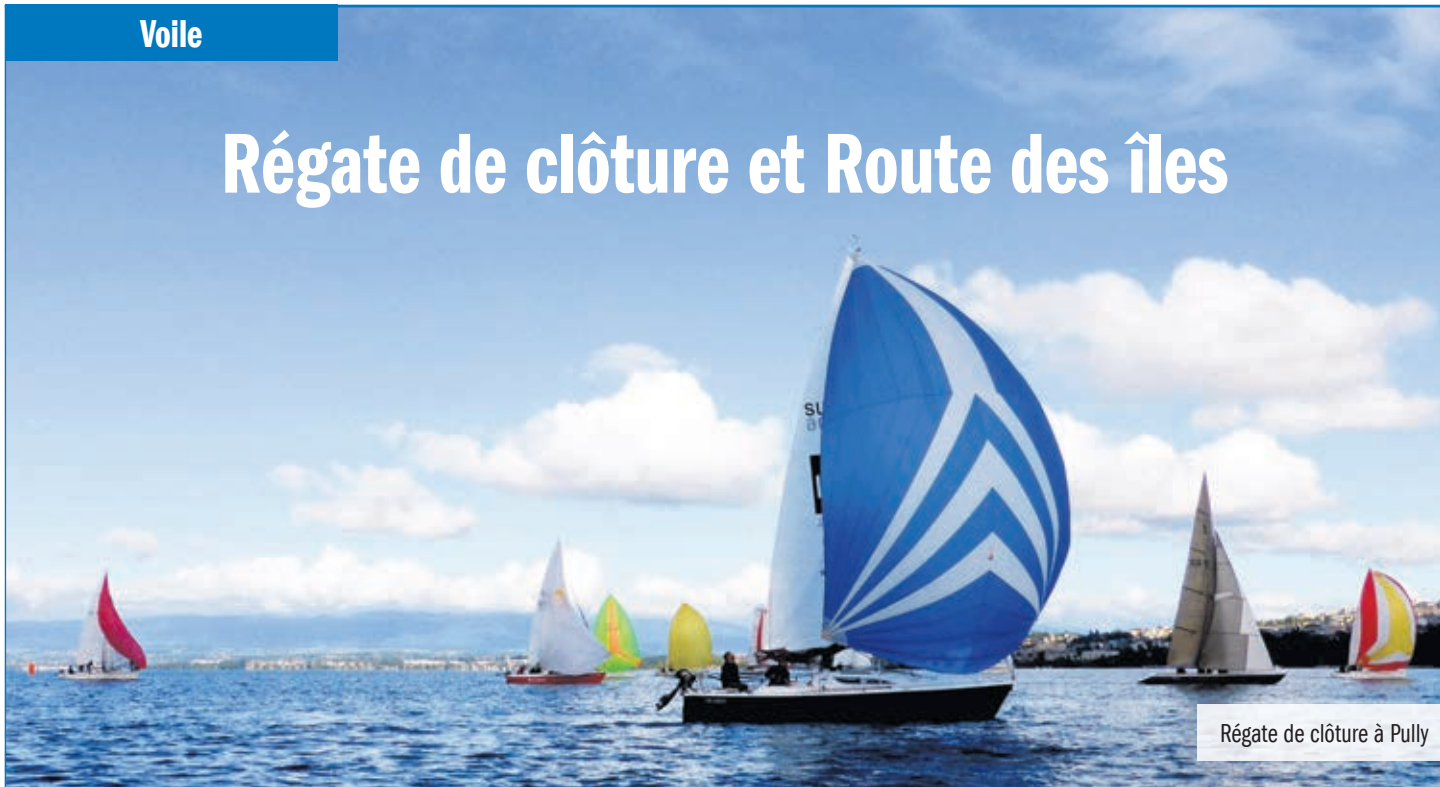
Régate de clôture à Pully

D imanche dernier a eu lieu la Régate de clôture du Club nautique de Pully . Faute d'airs établis, le comité de course n'envoya le départ qu'à 10h, 30 minutes après l'heure prévue. La ligne misait sur une bise qui ne s'est pas levée. Peu après le départ, les premiers concurrents hissaient le spi.