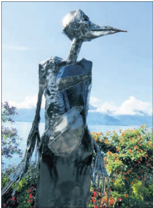
Caroline Brisset, «Black Bird»