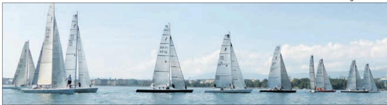
Régate de Toucan