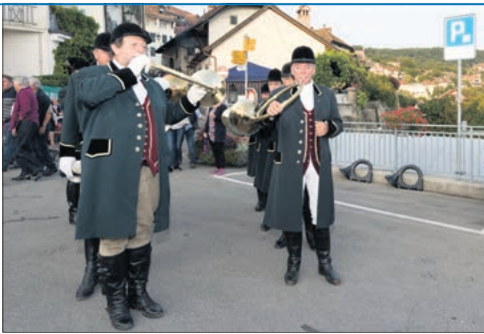
La fanfare Trompes d'Hauteville