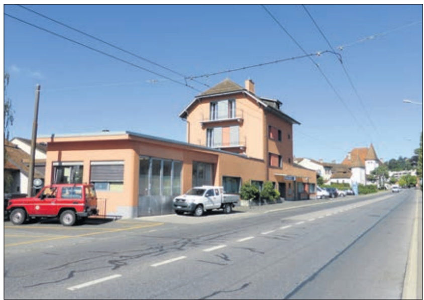
Bâtiment de l'APOL