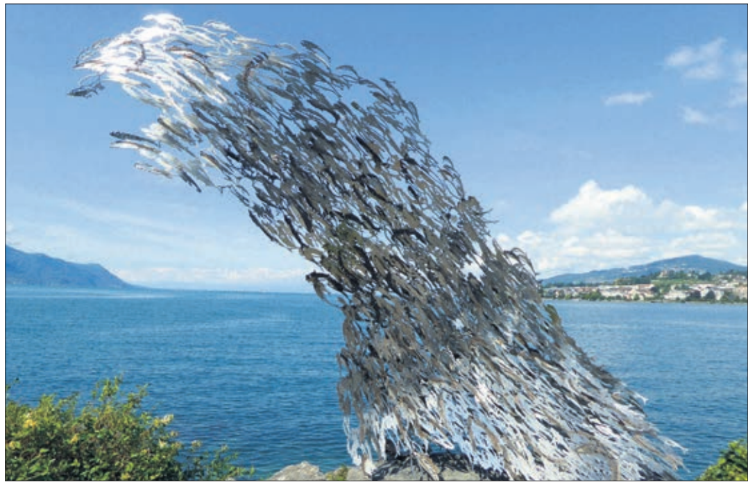
Studio C &amp; C, «Le banc de poissons»

Mais un plaisir nouveau - et tout aussi gratuit - vient s'y ajouter, et cela jusqu'à fin octobre. C'est la Biennale de sculptures en plein air, dont la première édition a eu lieu en 2008. Deux prix seront décernés à l'issue de la manifestation: celui du public et celui du jury. L'œuvre couronnée par le second sera acquise par la ville et exposée de façon permanente.