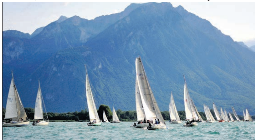
Régate devant l'île de Peilz