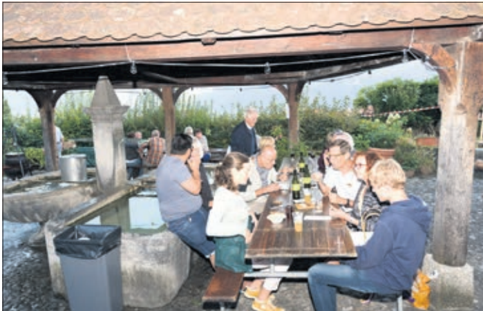
La cour et les tables du caveau du Boss Beer où des gens sont en train de festoyer