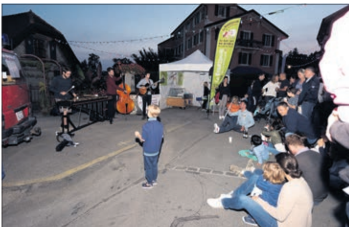
Des musiciens au coeur du Carroz