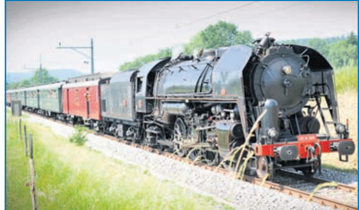
«Train qui est passé dans la région, samedi 24 juin»

Vous aussi, envoyez vos moments volés à: redaction@lecourrier-lavaux-oron.ch