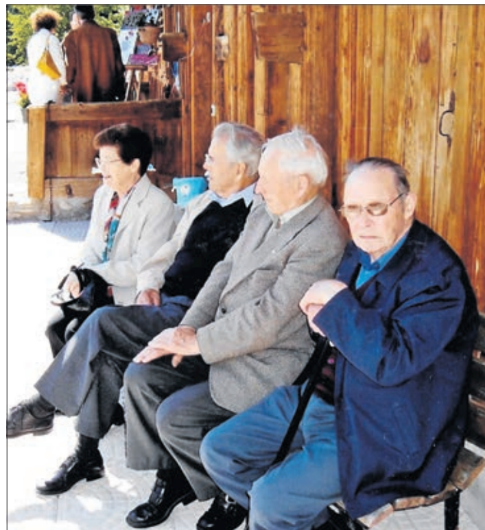
Des retraités fatigués après toute une vie de travail manuel à la campagne

Il fut un temps où les homes pour personnes âgées sortaient de terre comme des champignons. Cette prolifération a confirmé la réussite de ce mode d'habitat, alors que depuis au moins deux décennies, aucun nouveau home n'a été construit. Pour les aînés qui se doivent de quitter leur maison ou la ferme, ce développement des résidences a ses avantages, à condition de pouvoir payer la chambre, la restauration, les soins et autres frais dans leur vie quotidienne. L'explosion de cette offre ne s'explique pas seulement par la volonté des promoteurs, ni par le fait que la population des plus de 65 ans représente un marché en pleine expansion. Il y a parallèlement une forte demande de homes du fait que ceux qui existent sont complets à l'année, car ce mode de vie est entré à grands pas dans les mœurs. Et cela non seule-