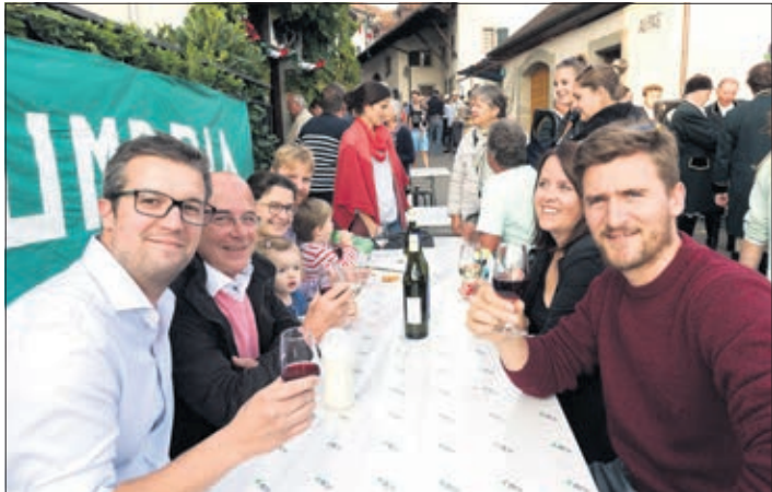
En plein coeur du quartier du Carroz