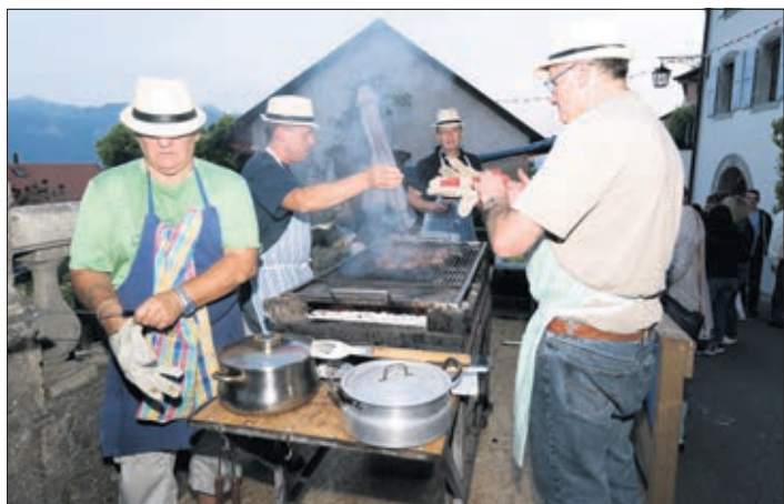
Le stand du Ski-club qui prépare des grillades