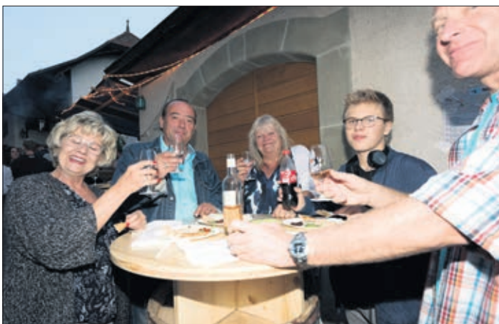
Une famille en train de déguster du vin et des produits du terroir