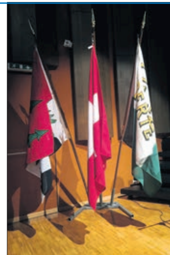
Les drapeaux suisse, vaudois et savignolan rappellent aux nouveaux habitants l'organisation politique de notre pays

A Savigny, comme dans bon nombre de communes de notre région, il importe à ses élus de favoriser l'adaptation des nouveaux venus. Il s'agit également de tisser un lien