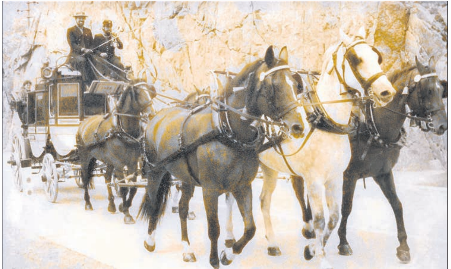
La diligence à cinq chevaux du Gothard