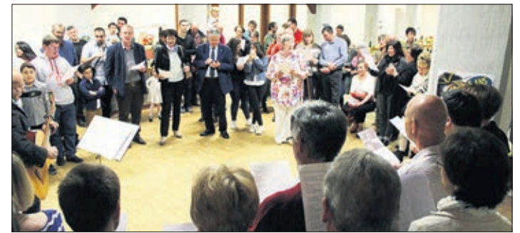
Tous les participants reprennent en chœur le chant d'anniversaire

«J'ai cinq ans. Si tu m'crois pas, j'te casse la gueule à la récré!» Mais il faut nous croire: «Parlons Français Moudon» a fêté ses cinq ans le vendredi 31 mars. La municipalité nous avait gracieusement prêté la salle des anciennes casernes. Un bienfaiteur avait offert les patates. Un autre les sets de table personnalisés.