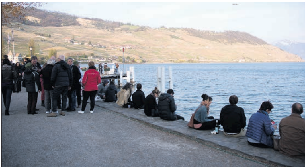
Les charmes des rives de Cully restent un atout majeur du festival