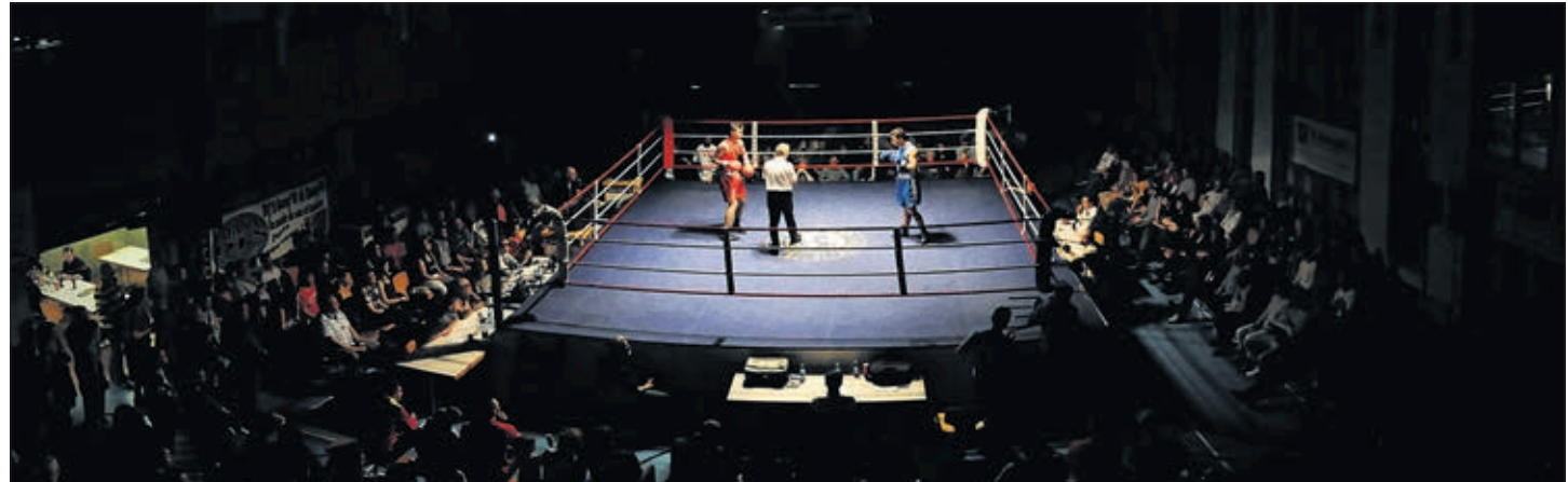
Salle polyvalente samedi 15 avril dès 18h30, combats à 19h30