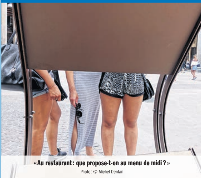
«Au restaurant: que propose-t-on au menu de midi ?»