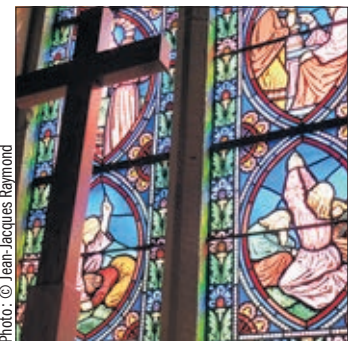
La croix: croisée de la souffrance et de l'espérance

Aussi, demander à un groupe de Gospel de chanter à Vendredi-Saint, c'est se mettre avec eux au diapason tant de la souffrance que de l'espérance déjà est en germe au cœur même du désespoir humain. C'est ce que les accents du Gospel savent si bien traduire, ses musiques et paroles puisant leurs origines dans l'ex-