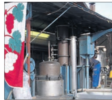
La vaillante distilleuse

point de mire exceptionnel, comme déjà depuis la place des Mariadoules, le visiteur pourra apprécier ce merveilleux Lavaux, le Léman et la Savoie, sans aucun doute inondés d'une luminosité exceptionnelle.