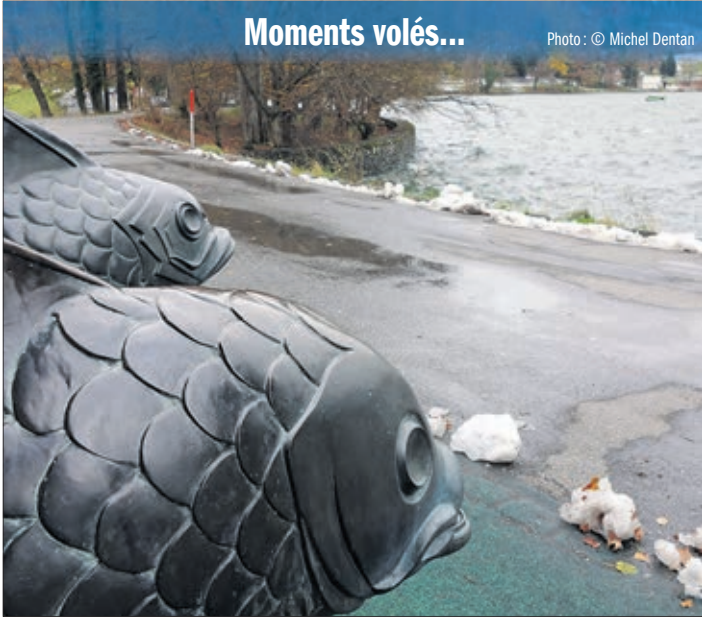
Froid extrême. Même les poissons hésitent à rejoindre leur élément naturel!