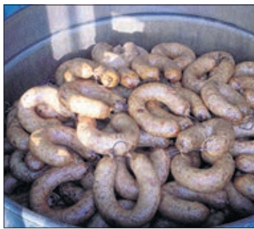
Saucisses sur leur lit de marc