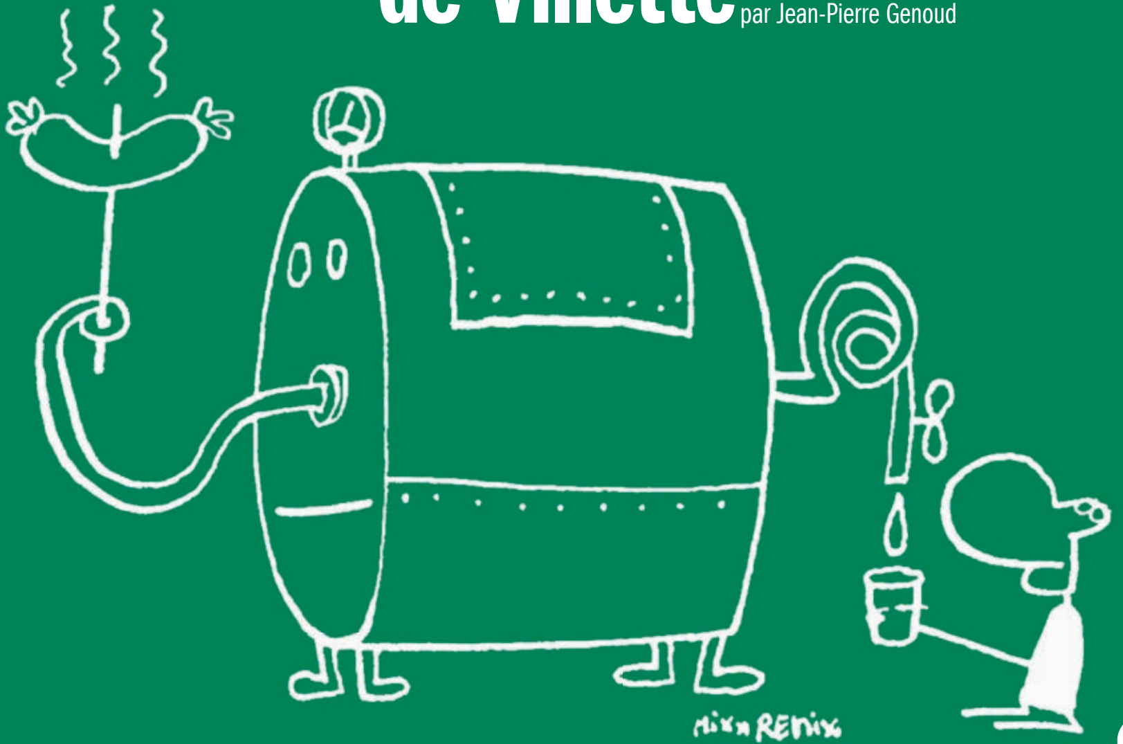
Illustration: © Mix & Remix