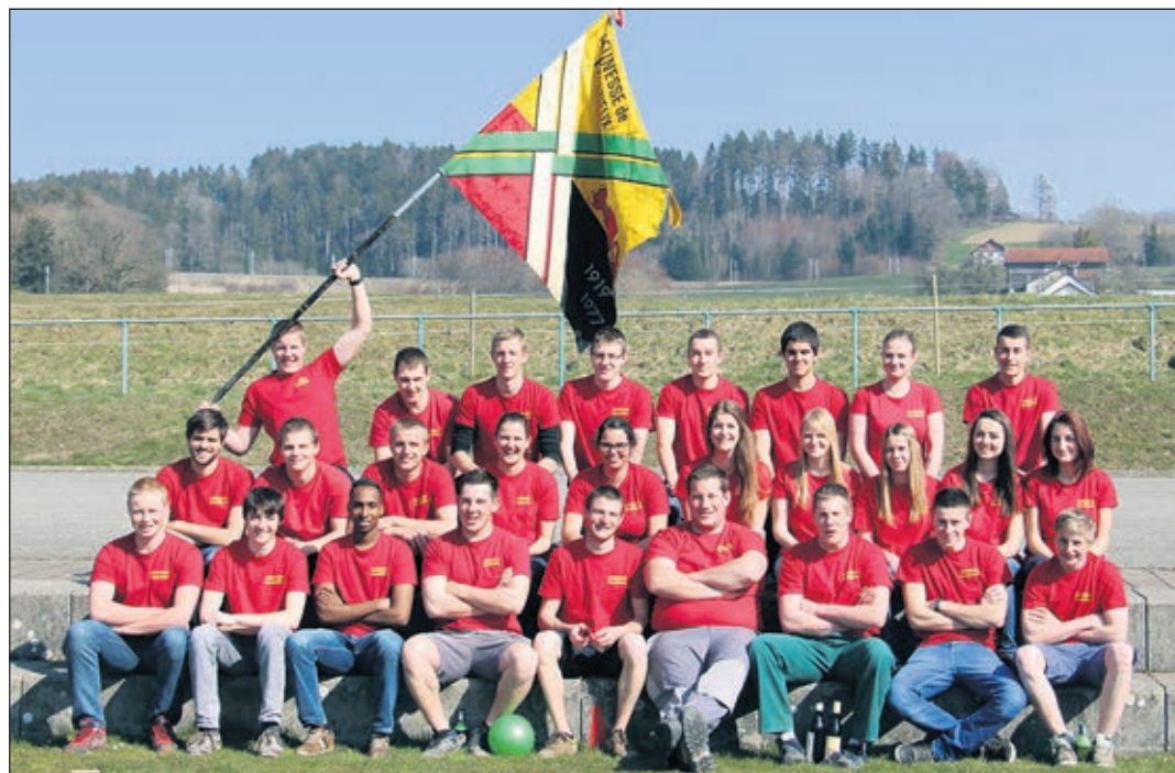
Jeunesse de Palézieux

Entreprenante et motivée, la Jeunesse de Palézieux, forte d'une quarantaine de membres, à majorité masculine, amorce 2017 comme à son habitude avec une semaine