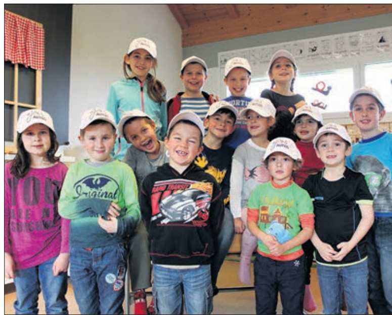
La Joyeuse équipe de Noël