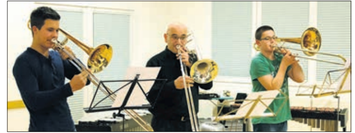
Trombonistes accompagnés par leur professeur

qui s'est clôturé ensuite par un apéritif auquel toutes les personnes présentes ont pu prendre part! Un moment sympathique et désormais traditionnel qui permet à toutes et tous de discuter et fraterniser autour d'un verre!