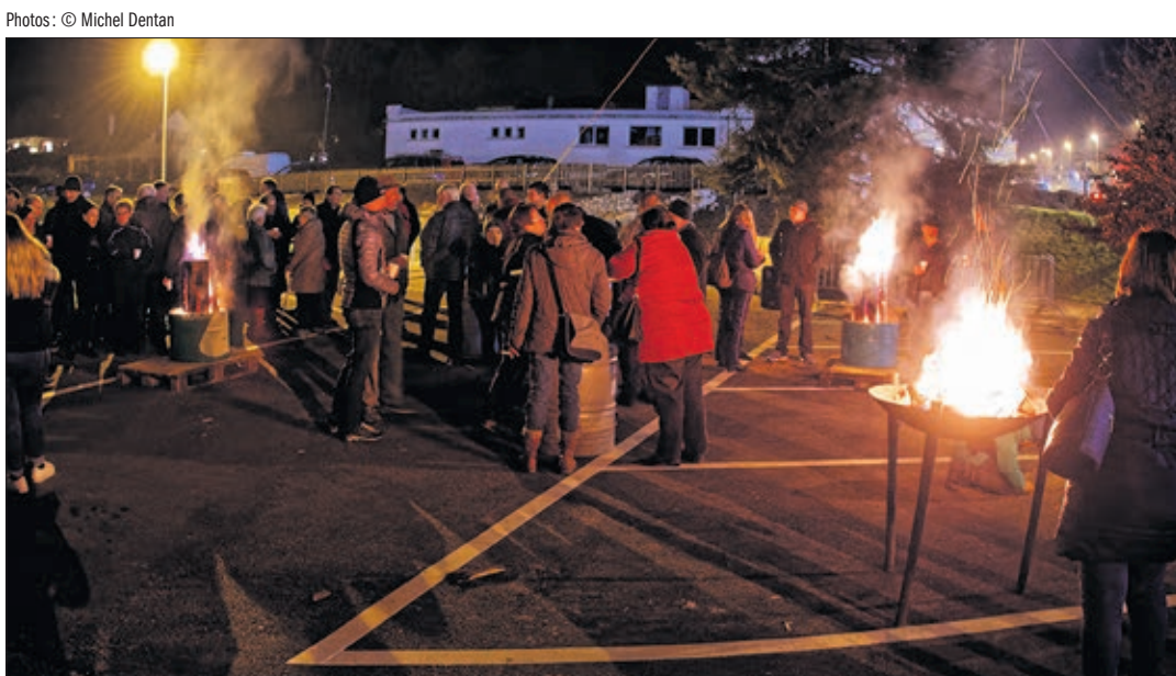
Illumination du sapin le 1 er décembre dernier