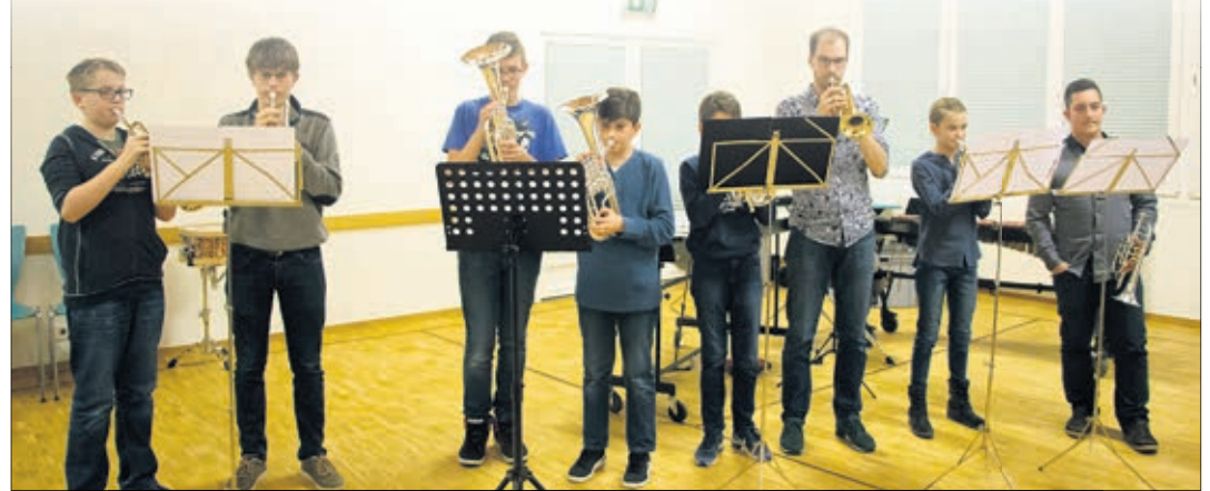
Une grande partie des élèves de la classe de cuivres accompagnés par leur professeur