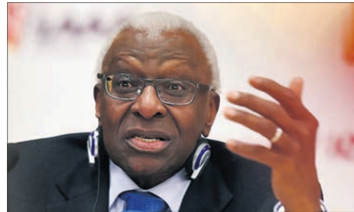
L'ancien président de l'IAAF Lamine Diack, poursuivi depuis novembre 2015 pour corruption et blanchiment aggravé, est soupçonné dans cette affaire d'avoir reçu un virement de 1,5 million d'euros de Balakhnichev

La lutte contre les opportunistes, les tricheurs, les jeux en lignes, le dopage et les manipulations en tout genre s'organise avec comme