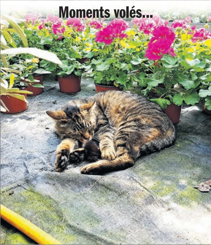
Seules les plantes sont à vendre; Roméo, lui, se repose seulement