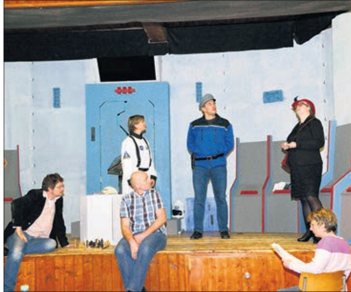
Une partie de la troupe au filage

«Un voyage presque parfait», titre de la pièce, nous narre l'aventure d'une poignée de Terriens seuls survivants sur terre et prêts à