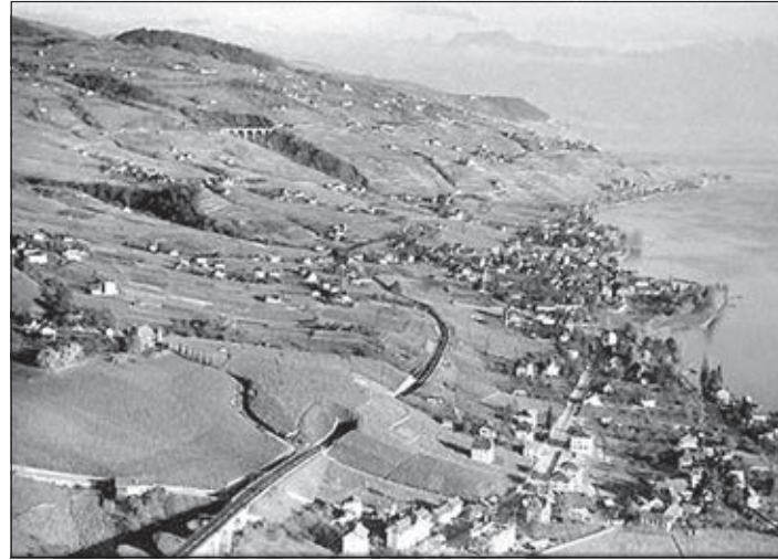
Paudex au premier plan

de la combustion, ce dernier se rendait à domicile pour enseigner la bonne utilisation. La houille, extraite jusqu'en 1870 puis à nouveau de 1894 à 1946, est surtout employée sur place par quelques industries existantes dans le valon de la Paudèze: verrerie (XVIII e siècle), briqueterie, cimenterie et fabrication de chaux et de plâtre (la plus importante du canton).